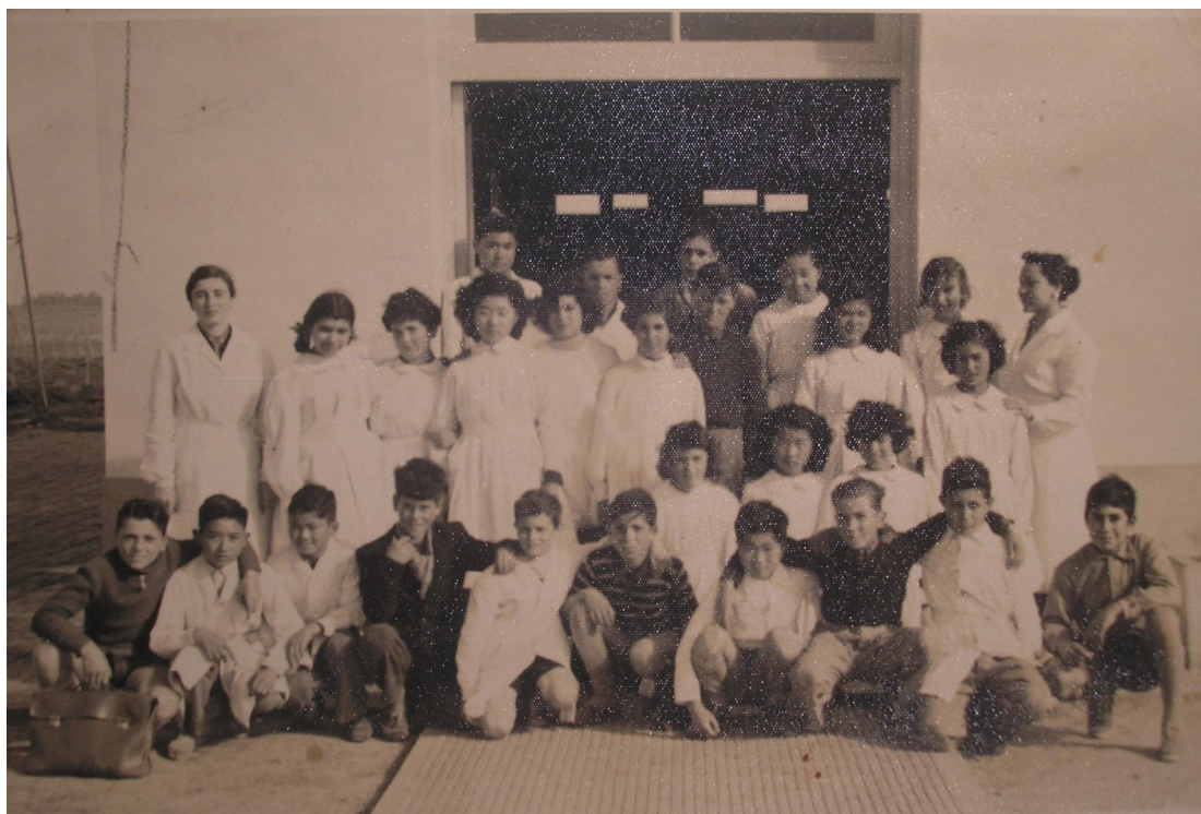
Imagen 2. Alumnos de la escuela primaria rural Nº 4 "Florencio Varela", circa 1956. Tomada en el nuevo edificio.