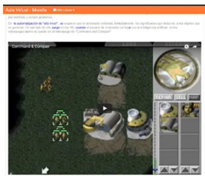
Figura 1. Captura 1

En las producciones encontramos, primero, relaciones que denominamos «de ejemplificación», a partir de las cuales se incorporan hipertextualmente al resumen objetos digitales que brindan un ejemplo del concepto sintetizado. Tal es el caso, por ejemplo, del resumen realizado por una de las alumnas sobre el concepto de automatización, de Manovich (2005). A continuación, un fragmento ilustrativo de dicho resumen: «En la automatización de “alto nivel”, se requiere que el ordenador entienda, limitadamente, los significados que incluyen a los objetos que se generan. Un ejemplo de ello surge en los ‘90, cuando el usuario de ordenador se topa con la inteligencia artificial en los videojuegos como se puede en el videojuego de “Command and Conquer”» ( Figura 1. Captura 1 ) (Asignatura Tecnología Educativa, 2016a). Luego, a continuación de este fragmento, encontramos un video de aproximadamente ocho minutos en el que se exhibe, a modo de ejemplo, la acción del videojuego en cuestión. Algo similar sucede cuando, en la misma actividad, uno de los alumnos presenta imágenes con capturas de pantalla del procesador de textos Microsoft Word ( Figura 2. Captura 2 ) para ejemplificar el concepto de modularidad, también de Manovich (2005).