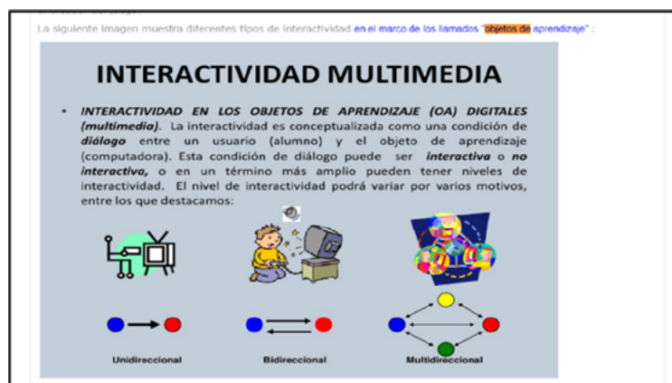
Figura 3. Captura 3

Además de la ejemplificación-expansión, la otra forma de relación que encontramos entre escritura de texto y otros lenguajes o modos en el marco que supone el resumen es la expansión-repetición. Mediante la incorporación de imágenes y videos orientados a la explicación –infografías, tutoriales, gráficos, entre otros–, los alumnos, por un lado, aportan nueva información sobre el concepto sintetizado; lo expanden con nueva información. Podemos aportar aquí el ejemplo de una alumna que, luego de sintetizar por escrito el concepto de interactividad, de Scolari (2008), incorpora a su resumen un cuadro (Asignatura Tecnología Educativa, 2016a) que explica los diferentes tipos de interactividad existentes en los llamados Objetos de aprendizaje digitales (Figura 3. Captura 3).