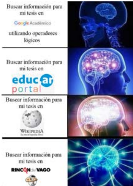
Imagen 2. Respuesta inicial de un grupo de estudiantes a consigna de producción de meme