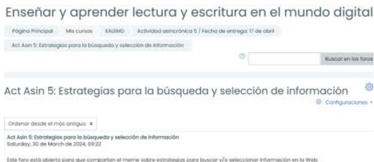
Imagen 1. Foro de entrega de producciones/ memes