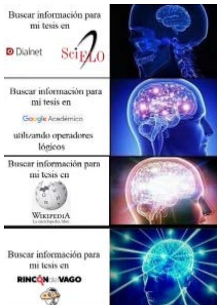
Imagen 3. Respuesta mejorada de los estudiantes sobre producción de meme post feedback con la docente