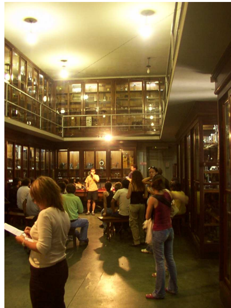
Imagen 3 - 4: Relevamiento Museo de Física UNLP. (3)Galería de Acceso. (4)Sala de Exposición.