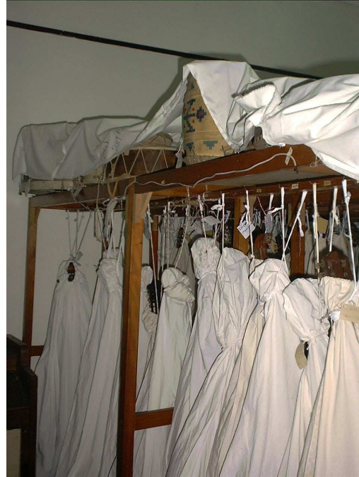
Imagen 1 - 2: Relevamiento Museo de Instrumentos Musicales Dr. Azzarini UNLP. (1) Sala. (2) Reserva.

La evaluación se organizó a partir de los siguientes pasos: primero se envió por e-mail la guía de preguntas a la persona que coordina las actividades en el museo, luego se pauteó una entrevista en la que se fueron abordando los temas propuestos por esta guía, en una tercera etapa se recorrió y relevó el museo con personal del mismo, tomando notas y fotografías.