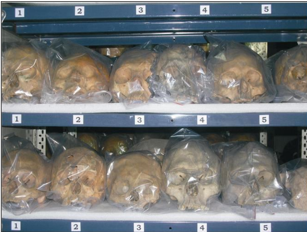
Figura 3. Detalle del uso de la espuma de polietileno expandido como base para contener los cráneos.

Respecto del diseño y confección de embalajes, se privilegió la estandarización de los formatos, con diseños económicos y fáciles de manipular. El aislamiento de la humedad y el polvo se solucionó con la utilización de bolsas de polietileno de alta densidad con pH neutro. Como base se confeccionaron módulos de espuma de polietileno expandido, la cual genera aislamiento térmico, absorbe humedad y no se descompone con el tiempo. A su vez sirve de amortiguación y protección para evitar los roces y desplazamientos (Figura 3). Estas medidas iniciales llevadas a cabo para afrontar los problemas identificados de conservación y bodegaje solucionan sólo parcialmente las condiciones ambientales de las colecciones, por lo que se espera a futuro mejorar aún más los sistemas de embalaje y almacenamiento. En la actualidad se está llevando a cabo el monitoreo del estado de las colecciones tratadas.