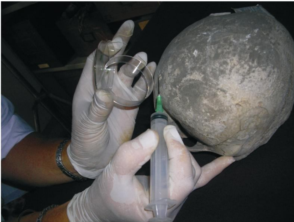
Figura 2. Detalle de la toma de muestras de hongos en un cráneo afectado.

mayores grados de deterioro, tanto físicos (diagénesis y acción mecánica pre y postdepositacional) como químicos (esporas de hongos, insectos, nidos, etc.), fueron seleccionados para una segunda etapa de trabajo que requiere de un tratamiento más complejo y costoso. En una primera etapa de esta línea de trabajo se inició la toma de muestras de hongos de los cráneos afectados para su cultivo y posterior identificación taxonómica 1 (Figura 2). Estas actividades permitirán identificar con precisión el agente actuante y de esa manera implementar un plan de acción que permita no sólo erradicarlo sino impedir nuevas proliferaciones.