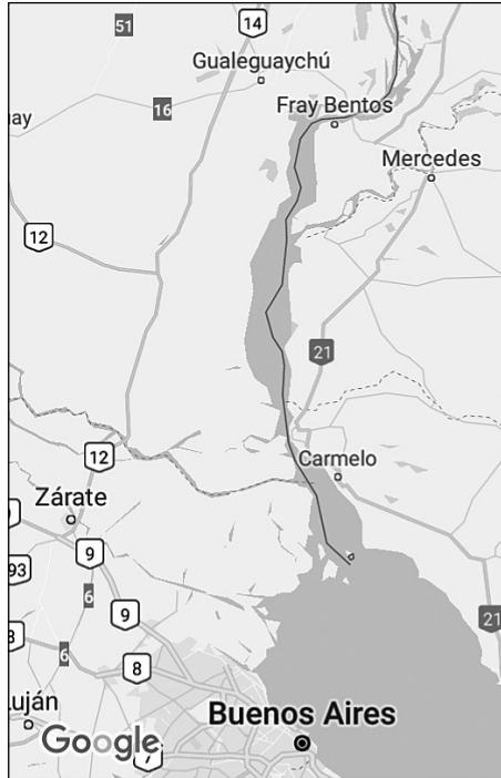
Rycina 1. Widok na Río de La Plata, rzekę Uruguay, z miastami Buenos Aires, Gualeguaychú (Argentyna) i Fray Bentos (Urugwaj)