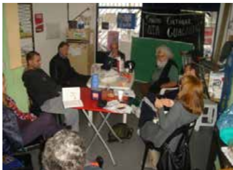
Figura 5. Reuniones de trabajo

Nos posicionamos así en que el trabajo apunta más a desarrollar el espíritu crítico y conocer diferentes técnicas de expresión para los niños o jóvenes que concurren al apoyo y así probablemente encontrarnos con el deseo de ellos. Empezamos entonces con una reflexión sobre la tarea concreta, más cercana a una evaluación de lo propuesto y lo logrado, y a revisar la orientación sobre la que se fundó este espacio de trabajo. Llegamos así a pensarnos en el marco de la educación popular. A través de este primer posicionamiento, y en diálogo con otra organización, se consiguió material para alfabetización de adultos. Allí se produjo otro nuevo reposicionamiento, ya que los voluntarios del apoyo escolar aprendimos que existe un enfoque educativo que se concentra no solo en alfabetizar sino en pensar que la alfabetización podría permitir reflexionar críticamente sobre la realidad. Estos cambios de posicionamiento ocurrieron en encuentros concretos en los que se producían grietas (en el pensamiento de los voluntarios del comedor) a partir de contrastar nuestras propias ideas con las de otros (de INCLUIR en este caso) o con nuestras propias ideas según quedaban registradas y podíamos revisitarlas.