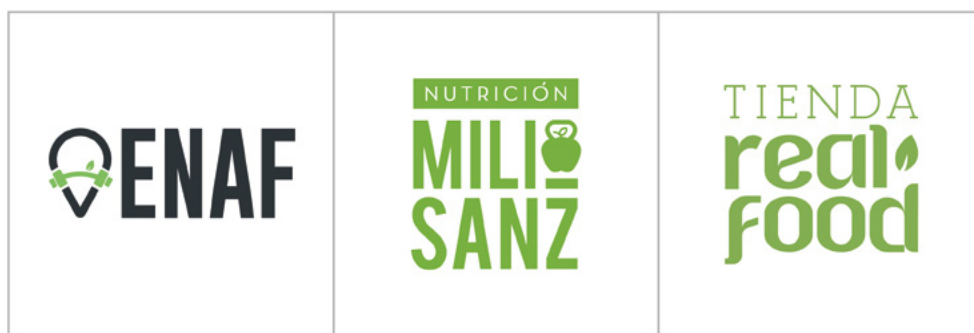
Figura 3. Sistema de identidad visual del centro ENAF.