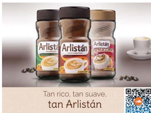
Propuesta publicitaria del código QR. Elaboración propia en base al sitio web de Arlistán.

Desde el punto de vista del marketing, cobra especial relevancia la coherencia que existe entre las emociones que genera este tipo de canciones compuestas y el actual lema de la marca 176 : “ tan rico, tan suave, tan Arlistán 177 ”.