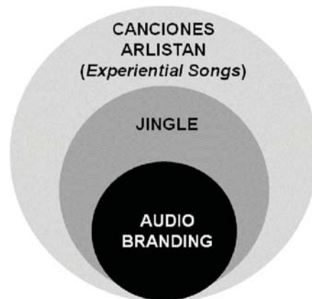
Categorización publicitaria de las canciones Arlistán. Elaboración propia.

branding , están destinadas a crear lazos sutiles entre productos y consumidores 172 .