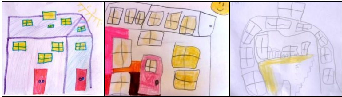
Figura 2. Primeras ideas de casas con ventanas en el techo y en todas sus paredes.

que se abra ”, “ con ventanas grandes ” o “ con ventanas de un costado y del otro ”. Como queda en evidencia, no se asocia la posición de las ventanas con la trayectoria solar.