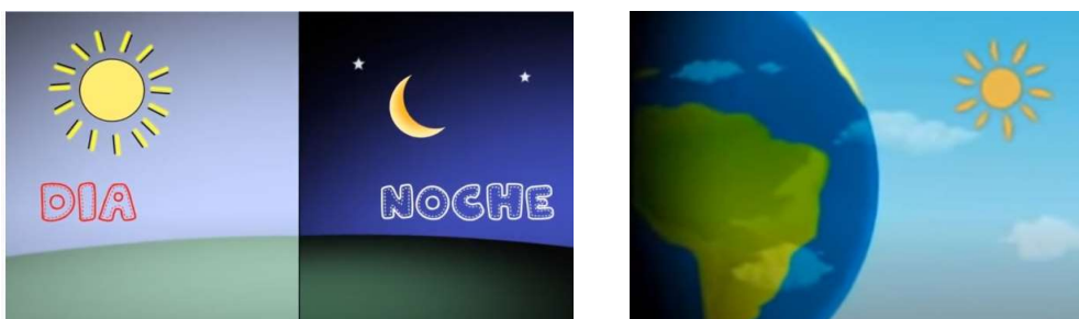
FIGURA 1. Ejemplos de errores detectados en los videos. Error conceptual (izquierda): presencia de la Luna en el cielo todas las noches tanto en la imagen como en el audio que la acompaña (v2). Error didáctico (derecha): dibujar el espacio exterior con los colores del cielo terrestre: celeste del lado hacia el Sol y negro del lado opuesto (v8).