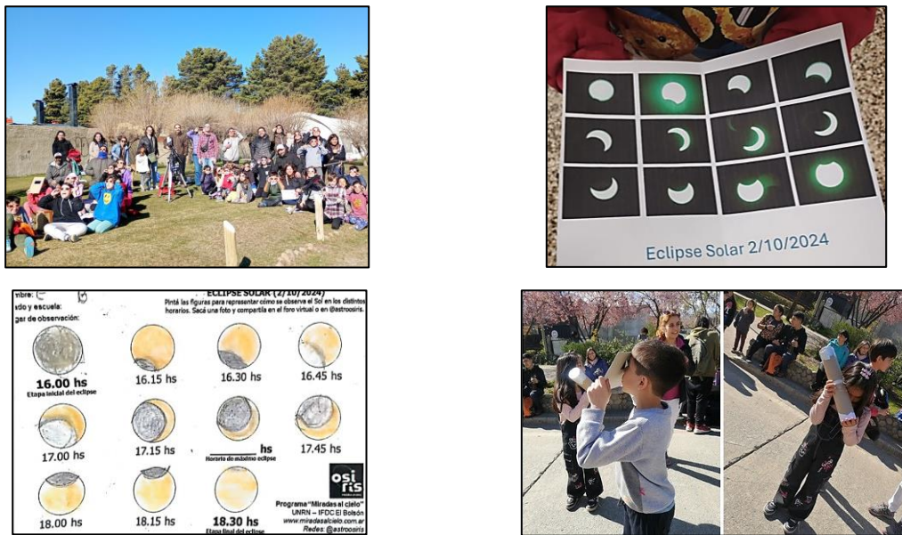
Figura 3. El cierre de la propuesta didáctica con los estudiantes de distintas escuelas de Bariloche y El Bolsón observando y registrando el eclipse solar parcial desde sus localidades.

Las actividades comenzaron el martes 1 de octubre por la mañana en la Escuela primaria 12 y en la Escuela secundaria 5, donde los estudiantes de Osiris coordinaron 6 talleres de astronomía para los estudiantes, finalizando las propuestas con una charla en cada escuela sobre el eclipse solar del día siguiente. De este modo, se llegó con actividades a unos 200 estudiantes de primaria y 150 de secundaria en una sola mañana (figura 4).