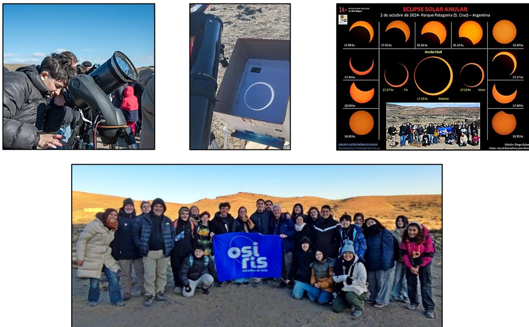
Figura 6. Algunas imágenes de la observación del eclipse anular de Sol desde Parque Patagonia.

Los estudiantes del grupo instalaron los equipos en un camino de autos del camping y a su alrededor se fueron acomodando unos 80 observadores procedentes de todo el país y también de otros lugares del mundo. Para el horario de inicio, cerca de las 16 hs, el grupo había instalado un telescopio solar, dos telescopios con filtro solar, un telescopio para observar por proyección, dos prismáticos con filtros y se tenían cámaras oscuras, anteojos para eclipses y filtros de máscara de soldar para poner a disposición del público. El tiempo acompañó continuamente las actividades con un cielo despejado y Sol a pleno durante toda la tarde, por lo que pudimos observar el fenómeno sin inconvenientes, incluso durante la baja muy sensible de temperatura que se dio cerca de la anularidad, cuando la Luna cubrió un 86% de la superficie del Sol (figura 6). Es posible visualizar los registros de lo vivido y de lo realizado visitando este sitio web: sites.google.com/view/eclipseanular2024 .