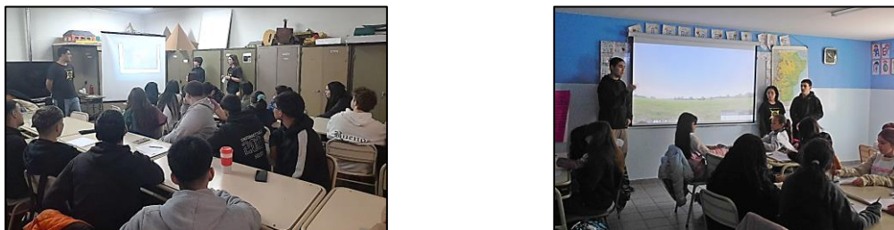
Figura 4. El Grupo Astronómico Osiris coordinando talleres de astronomía en las escuelas.

Las actividades comenzaron el martes 1 de octubre por la mañana en la Escuela primaria 12 y en la Escuela secundaria 5, donde los estudiantes de Osiris coordinaron 6 talleres de astronomía para los estudiantes, finalizando las propuestas con una charla en cada escuela sobre el eclipse solar del día siguiente. De este modo, se llegó con actividades a unos 200 estudiantes de primaria y 150 de secundaria en una sola mañana (figura 4).