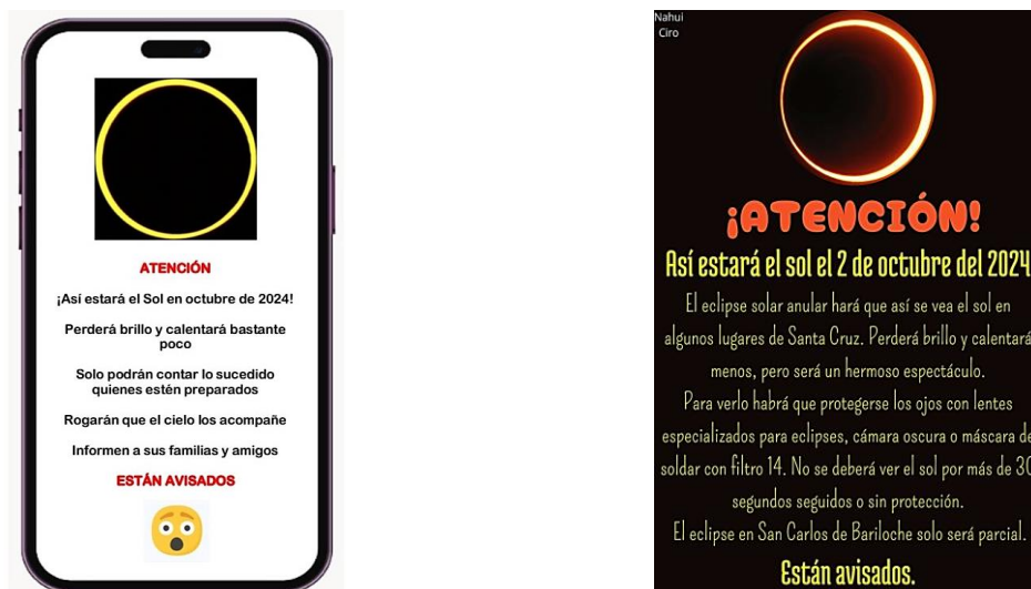
Figura 2. El mensaje “alarmista” al inicio de la propuesta didáctica (izquierda) y la modificación realizada por estudiantes de 6to. grado luego de finalizado su desarrollo (derecha).

A su vez, se pretende que los estudiantes puedan asociar los eclipses con fenómenos naturales que ocurren regularmente y que son maravillosos de disfrutar, a diferencia de noticias o mensajes pseudocientíficos que los asocian a peligros o malos presagios. En función de ello, la propuesta comienza con una situación en donde a un estudiante le llega un mensaje al celular en el que le advierten de que sucederá algo malo, sin entender demasiado qué. El mensaje es discutido con las ideas iniciales de los alumnos, pero luego se vuelve a discutir al final ya teniendo conocimiento sobre los eclipses, lo que lo vuelve comprensible y factible de ser modificado para ser reenviado con más información sobre el eclipse a todas las familias de los estudiantes con el fin de que lo observen (figura 2).