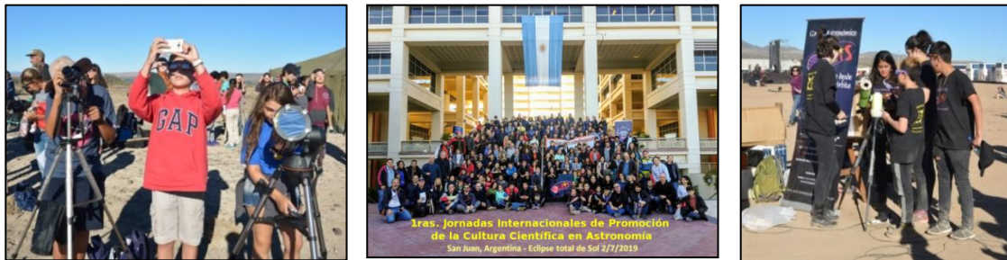
Figura 4. Estudiantes de nivel medio del Grupo Osiris poniendo a disposición del público instrumental astronómico en los sitios de observación organizados por el grupo para los eclipses solares de febrero de 2017 (izquierda) y julio de 2019 (derecha). Para el eclipse total del 2 de julio de 2019 se organizaron charlas previas en la ciudad de San Juan (centro).

Por otro lado, se han realizado actividades públicas de observación de eclipses solares en distintas localidades, de las cuales han participado miles de personas. Se observaron los eclipses parciales de Sol del 11/9/2007 (desde Leleque, Chubut), del 11/7/2010 (desde El Maitén, Chubut), del 13/11/2012 (desde El Bolsón), del 15/2/2018 (desde El Bolsón y Bariloche) y del 30/4/2022 (desde Bariloche). A su vez, se destacan las jornadas públicas con charlas de astronomía los días previos y la organización de observaciones públicas para cada eclipse solar total o anular: eclipse anular del 26/2/2017 (Sarmiento, Chubut) y eclipses totales de Sol del 2/7/2019 (Bella Vista, San Juan) y del 14/12/2020 (Valcheta, Río Negro). Los registros de estas actividades pueden verse en la página www.eclipses.com.ar (Figura 4).