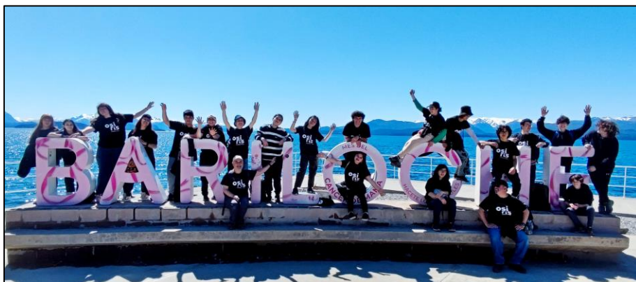
Figura 3. Osiris en Bariloche durante el 13vo. Encuentro de Jóvenes Astrónomos (2023).

Entre las propuestas que se destacan, anualmente se organizan los Encuentros de Jóvenes Astrónomos (E.J.A.), los cuales constituyen “minicongresos” de astronomía dirigidos a niños y jóvenes de entre 11 y 18 años en los cuales se llevan a cabo propuestas de difusión de la temática tales como charlas y talleres, observaciones del cielo, funciones de planetario, lanzamiento de cohetes de agua, etc, en un marco donde las vivencias agradables y significativas potencian las ganas de aprender de los participantes. Los EJA se llevan a cabo en diferentes localidades, habiéndose llevado a cabo 13 EJAs desde el año 2009: El Bolsón (2009 y 2018), La Plata (2011), Chivilcoy (2012), La Punta (2013), Malargüe (2014), Las Grutas (2015), Bariloche (2016 y 2023), San Rafael (2017), Ing. Jacobacci (2019), El Chocón (2021) y Perito Moreno (2022). En total, en estos encuentros participaron más de 10.000 estudiantes y docentes (Figura 3).