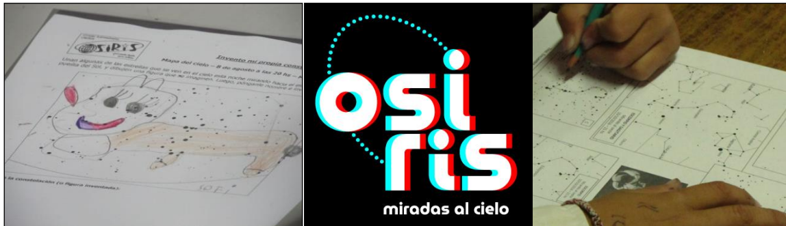
Figura 2. Producciones en los talleres de Osiris (logo en el centro). Izquierda: taller Invento mi propia constelación (1er. grado). Derecha: taller Contando estrellas (5to. grado).

Entre los talleres que se desarrollan, se destacan: Invento mi propia constelación (para primer ciclo), Secretos del cielo diurno (sobre el movimiento del Sol en el cielo), Secretos del cielo nocturno (sobre el reconocimiento de constelaciones), Buscando planetas (sobre cómo distinguir planetas a simple vista), Contando estrellas (sobre la contaminación lumínica) y Qué forma tiene la Tierra (sobre las evidencias de la esfericidad de la Tierra) (Figura 2).