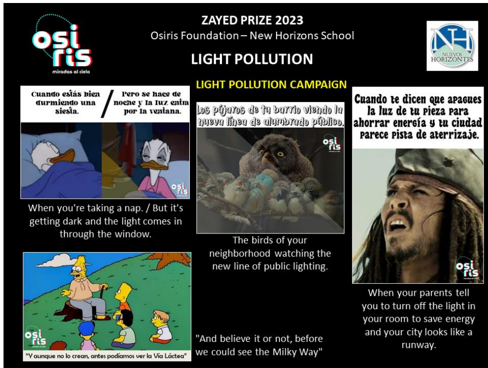
Figura 2. Memes sobre la problemática realizados por estudiantes del Grupo Osiris.