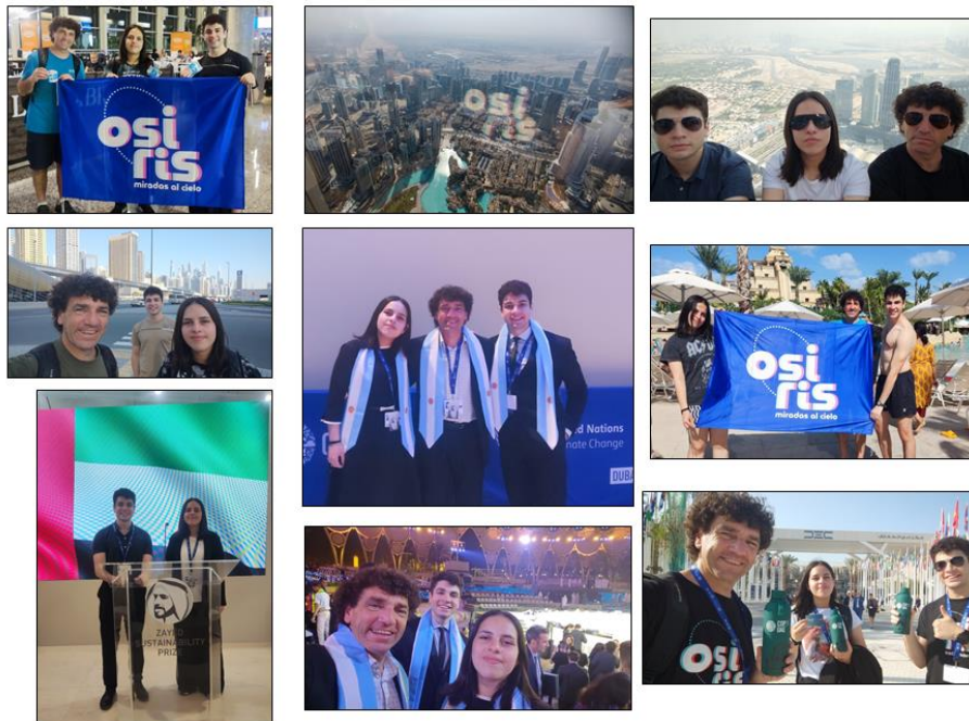
Figura 5. Registros del viaje a Dubai de los integrantes del Grupo Astronómico Osiris.

Con el fin de comunicar la experiencia, durante el viaje se realizaron transmisiones en vivo y se compartieron imágenes del mismo, estando disponibles para su visualización en las cuentas del Grupo Osiris en Instagram , Facebook y Tik Tok . La ceremonia de premiación está disponible en la cuenta de YouTube del Premio Zayed . Por último, luego del regreso de Dubai se pudo describir el proyecto y lo realizado en una nota en el Canal 4 de El Bolsón.