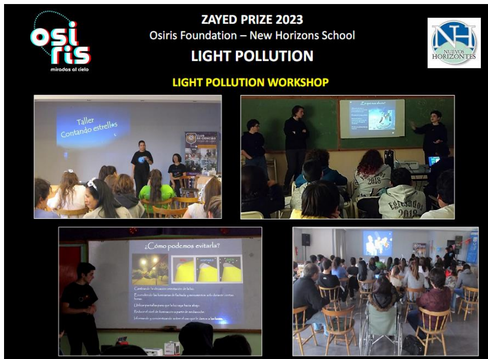
Figura 3. Estudiantes del Grupo Osiris coordinando un taller sobre contaminación lumínica.