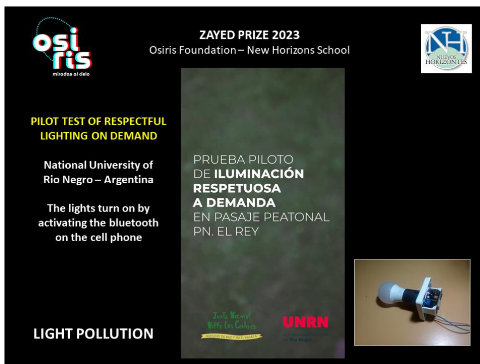
Figura 4. Desarrollo tecnológico para encender las luminarias a demanda activando el Bluetooth en el celular si el peatón lo considera necesario.