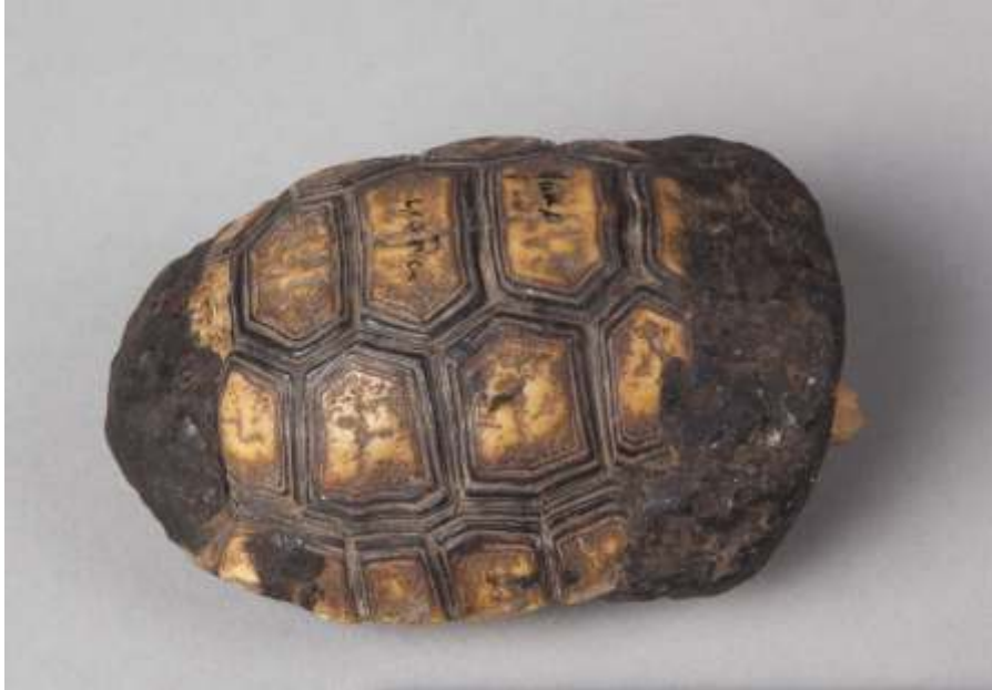
Imágenes 1 (pág. ant.) y 2. Caparazones de tortuga del río Parapetí (Bolivia)..

En el departamento de Beni, Cavour (1994) cita el "resonador de peta", caparazón completo de tortuga de río ( peta , en el oriente boliviano) percutido con una baqueta de hueso o frotado con cera de abeja.