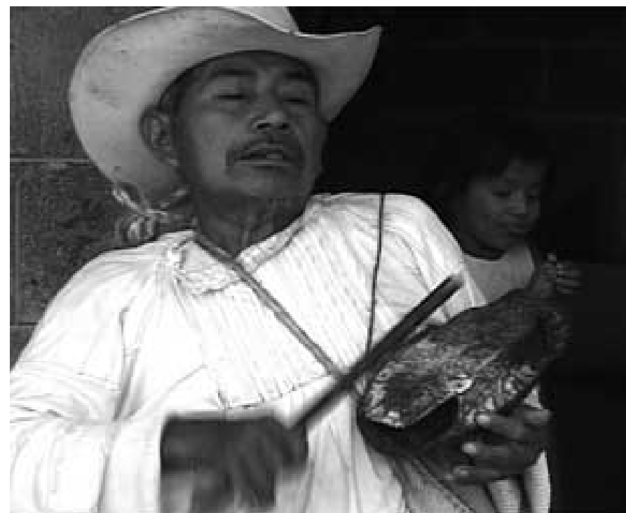
Imágenes 8 y 9. Tocador de concha de Tecacahuaco, (Atlapexco, Hidalgo, México). [Fotos: http://www.jornada.unam.mx/ ].