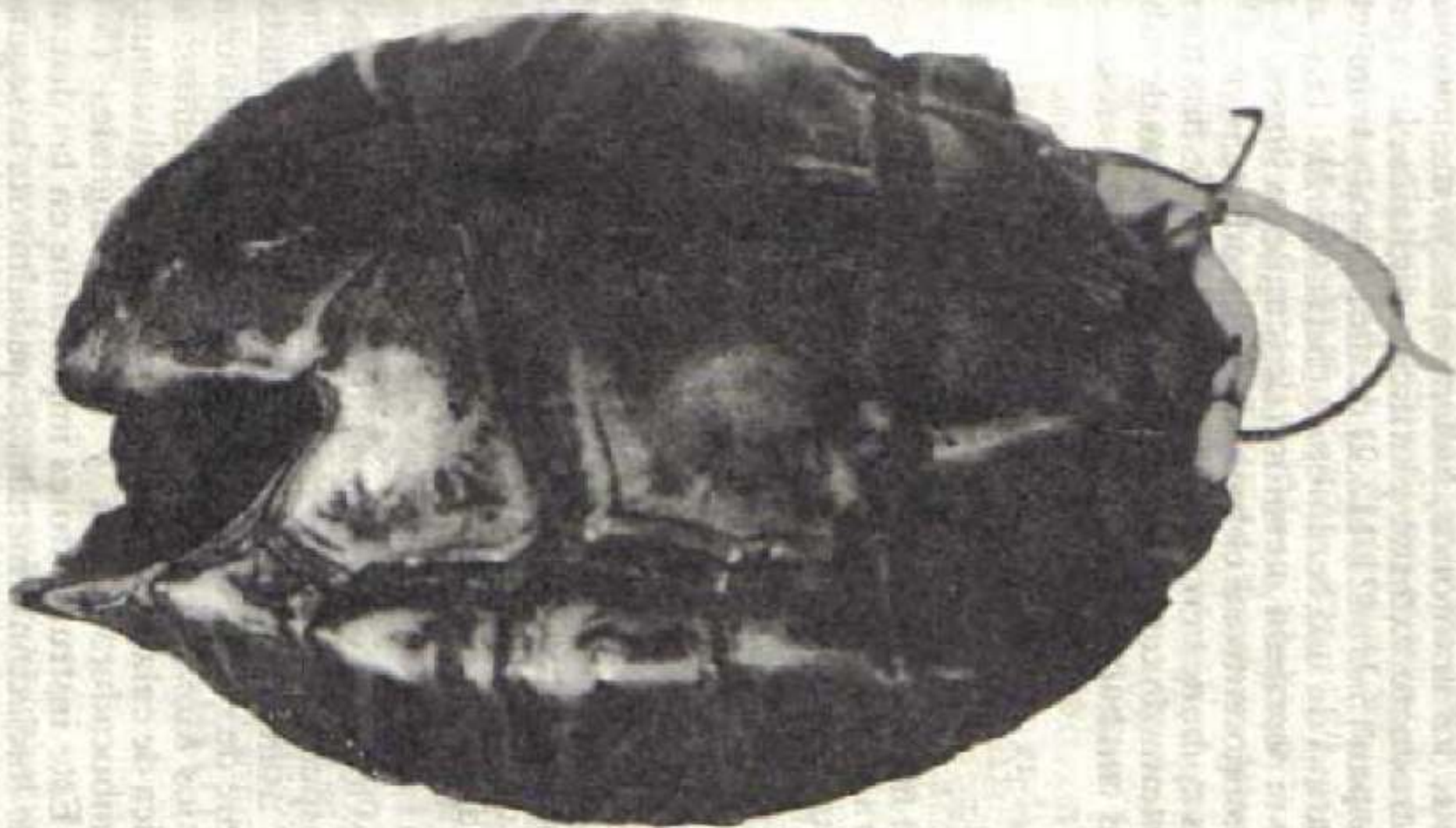
Lámina 5 Caparazón de Tortuga (Ijka) Sierra Nevada