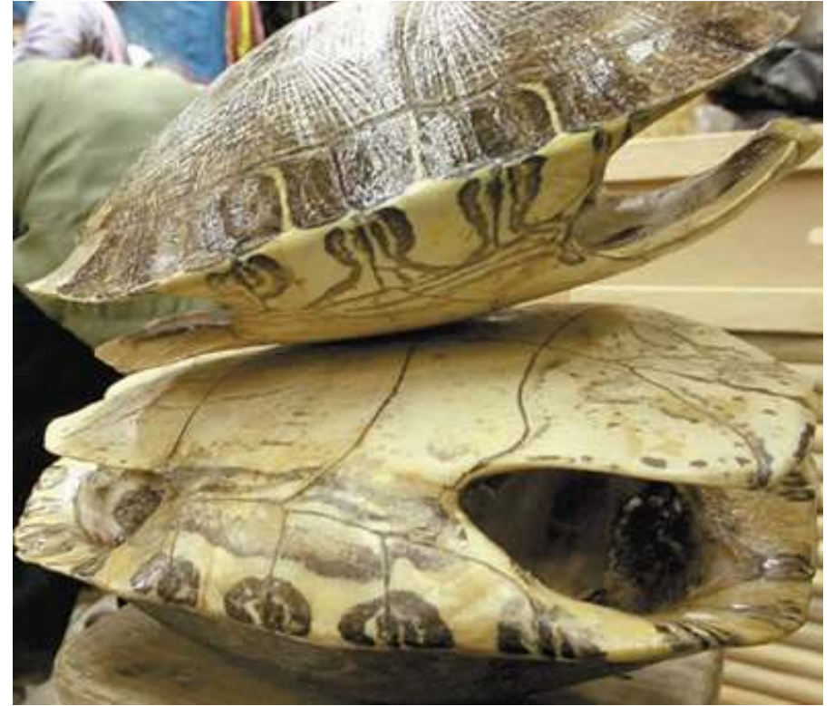
Imagen 5. Tucutítutu de Guatemala.

En Panamá, los Emberá o Ēpërá (Comarca Emberá-Wounaan y provincia de Darién) ejecutan el chimigúí , un caparazón percutido con una baqueta de madera, mientras que los Ngäbe o Guaymí (Comarca Ngäbe-Buglé y provincias de Bocas del Toro, Veraguas y Chiriquí) emplean la ñelé , que lleva cera untada en el borde del cuello y se frota con el borde de la mano, desde la muñeca hasta la punta de los dedos. Esta última, también llamada guelekuada o seracuata , es uno de los principales