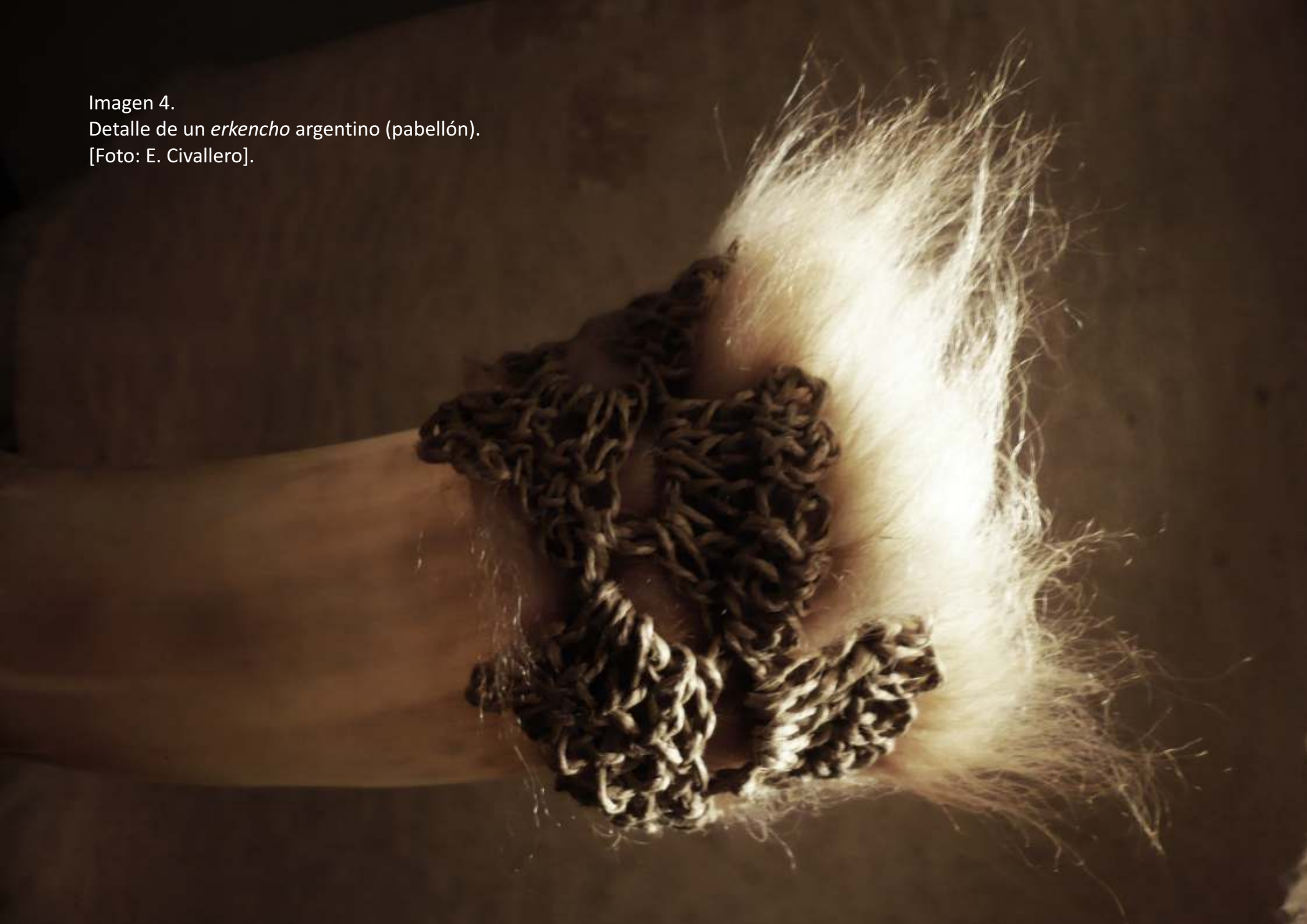
Imagen 4. Detalle de un erkencho argentino (pabellón).