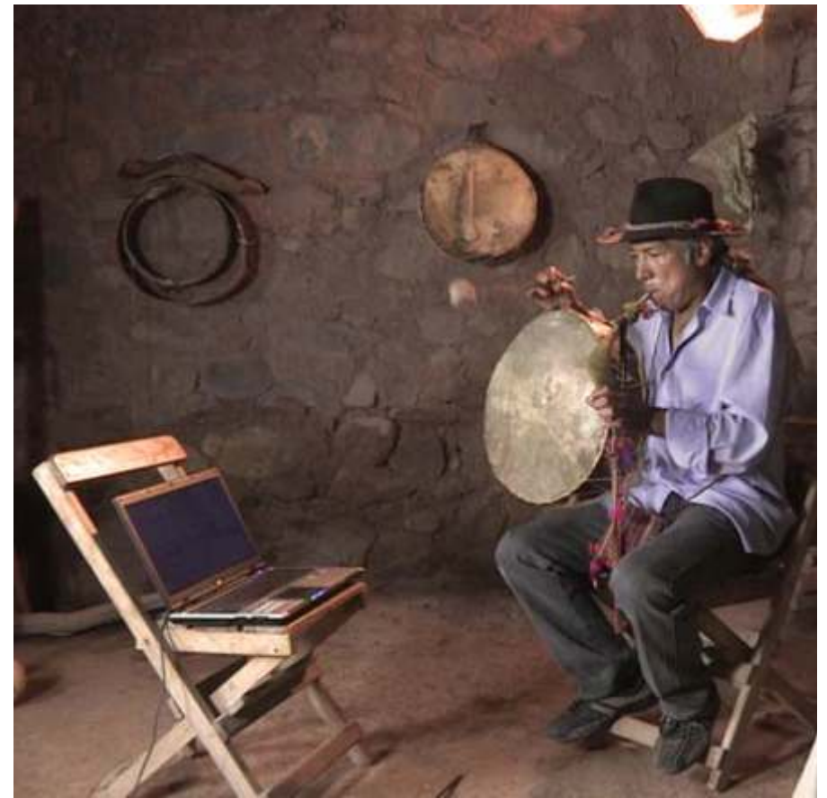
Imagen 10. Intérprete argentino de erquencho . [Foto: http://pallcafilm.blogspot.com.es/ ].