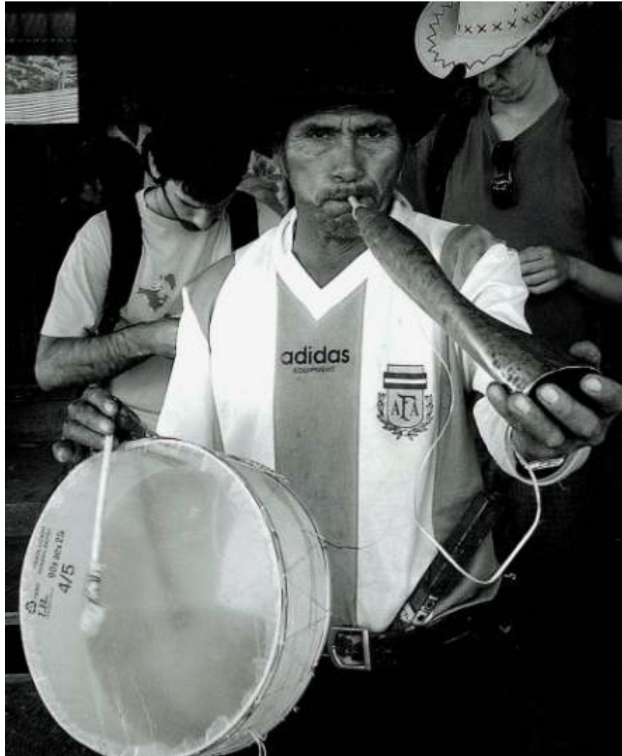
Imagen 11. Intérprete argentino de erquencho . [Foto: http://www.fotorevista.com.ar/ ].

Existen variantes regionales de erquencho . En Argentina es utilizado en toda la provincia de Jujuy y en el área de pre-puna de la provincia de Salta, al noroeste del país. En el altiplano jujeño se lo suele construir con cuerno de cabra (debido a la escasez de ganado bovino) y en el oriente de la misma provincia, con chapa de cobre o bronce. En Salta se encuentran erquenchos que combinan asta y metal y alcanzan tamaños considerables. En algunas versiones modernas, los constructores argentinos no cortan la lengüeta a partir de la boquilla , sino que realizan un hueco rectangular en ella e insertan allí una lámina de placa radiográfica u otro material similar. Esto, por cierto, convierte al clarinete en heteroglótico.