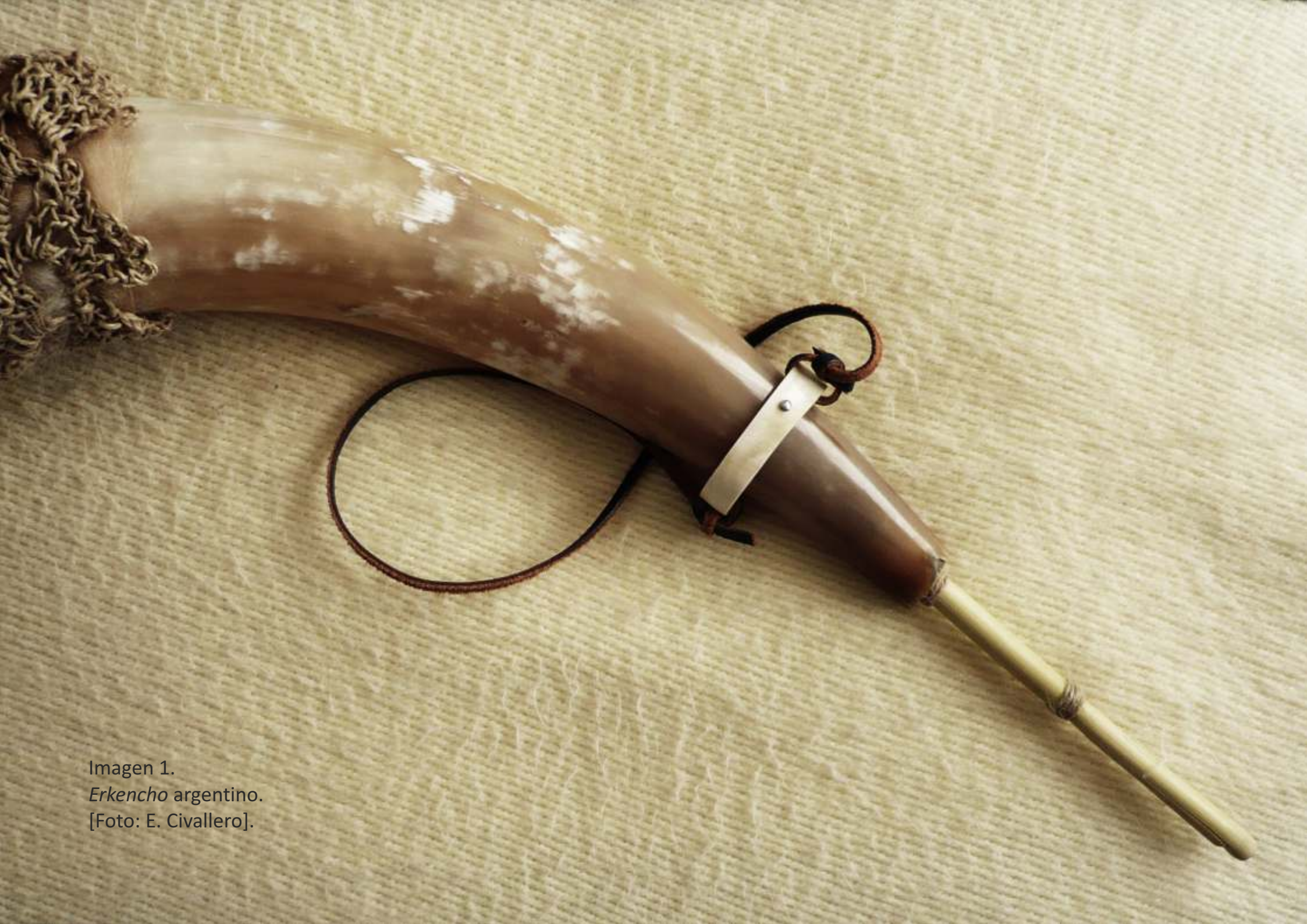
Imagen 1. Erkencho argentino. [Foto: E. Civallero].