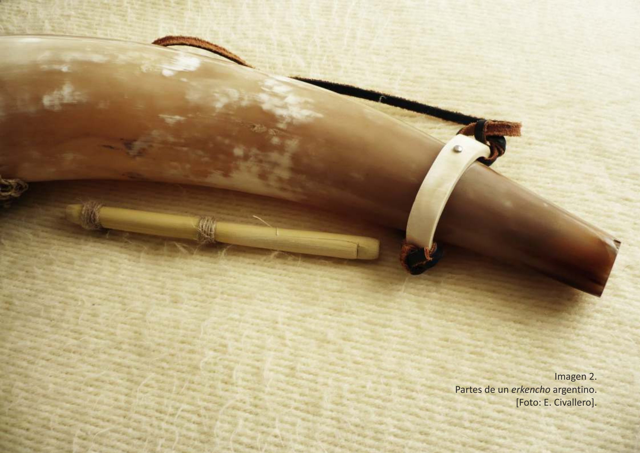
Imagen 2. Partes de un erkencho argentino..