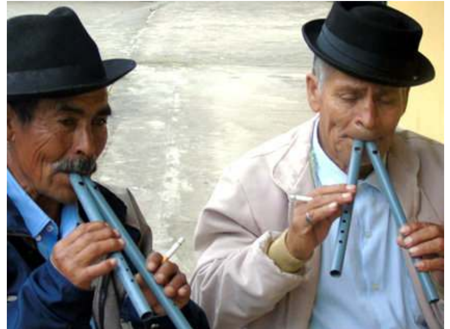
Imagen 1. Intérpretes de dulzainas en San Miguel de Uyumbuco de Perucho. [Foto: La Hora, 2016].