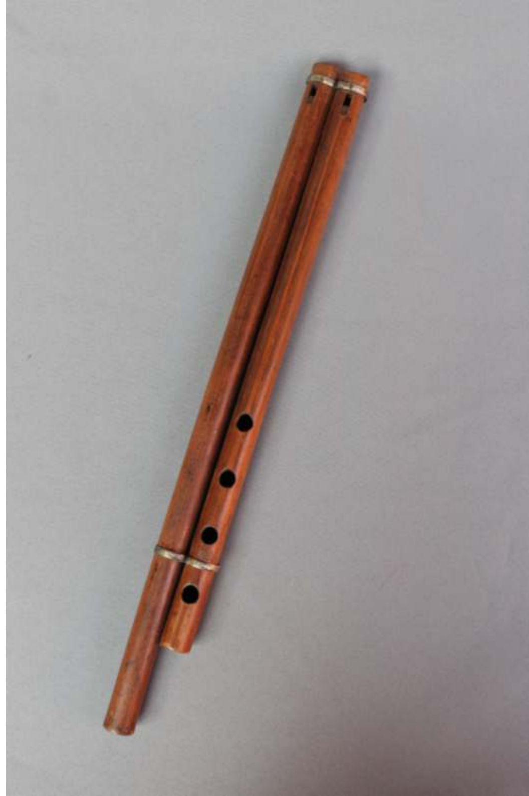
Imagen 5 [pág. ant.]. Flauta doble de pico (Cusco).