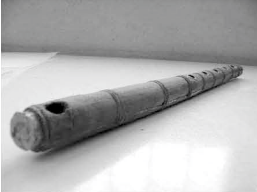
Imagen 1. Flauta transversa arqueológica.

o aisladas, con el extremo distal abierto o semi-abierto y dotadas de orificios de digitación.