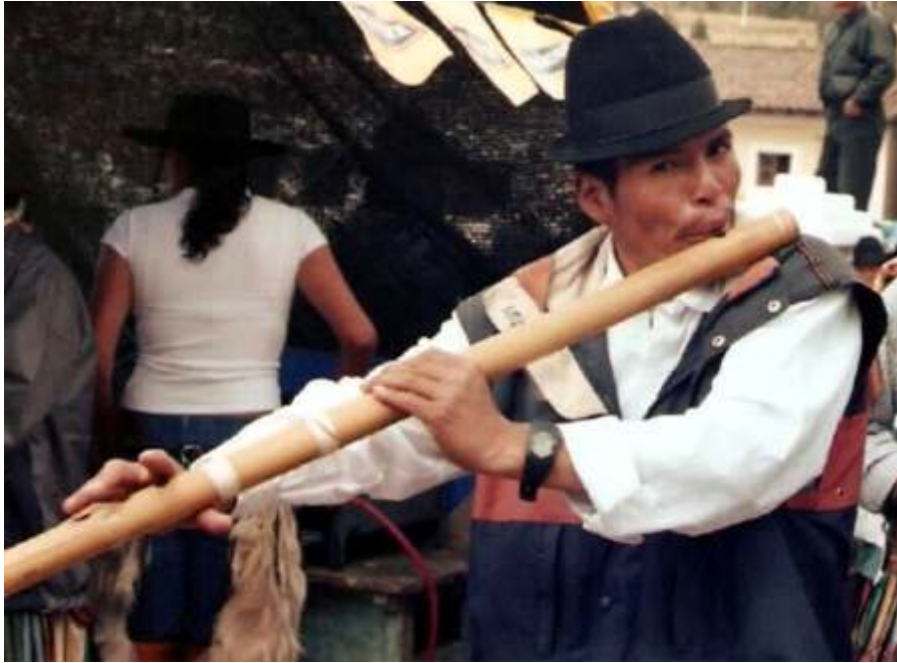
Imagen 10. Intérprete de tunda o yacuchimba . [Foto: Origen no registrado].

La flauta de carrizo , flauta de zuro , traversa o pífano mide entre 30 y 50 cm y posee 6 orificios de digitación. Generalmente se la toca en parejas de flauta "macho" y flauta "hembra". Está presente a lo largo de toda la serranía, incluyendo las provincias de Cotacachi, Cotopaxi, Pichincha e Imbabura.