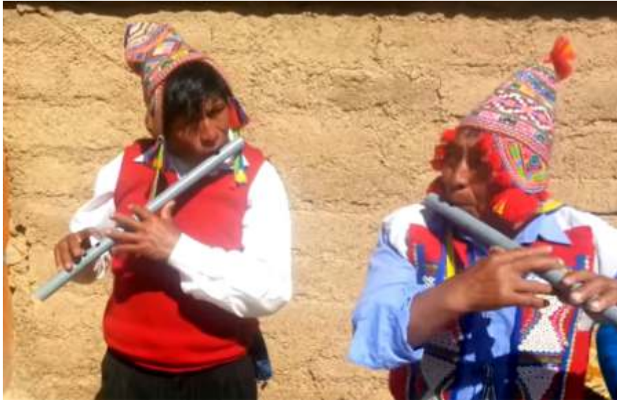
Imagen 9. Wayri ch'unchu de Ocongate (Cusco)..

dia (departamento de Puno), hecho de una pieza de caña de 45 cm, provisto de 6 orificios y empleado, como en la vecina Bolivia, en la danza de los chunchos. O el del pinkullo , pinkullo , través o pito , una flauta de caña ( mamac , carrizo , caña brava ) o de madera de 20-30 cm de largo, con 5 orificios superiores y uno inferior, que se acompaña con caja y se interpreta en la provincia de Huamanga