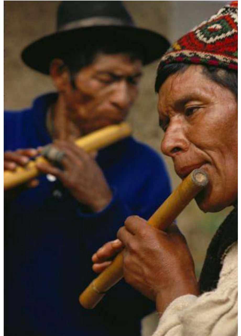
Imagen 5 (pág. ant.). Pifanos de Bolivia. [Foto: Origen no registrado].