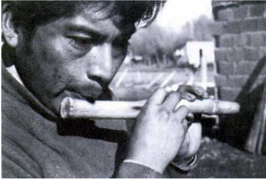
Imagen 2. Artesano Mapuche (Argentina) tocando la kina ..