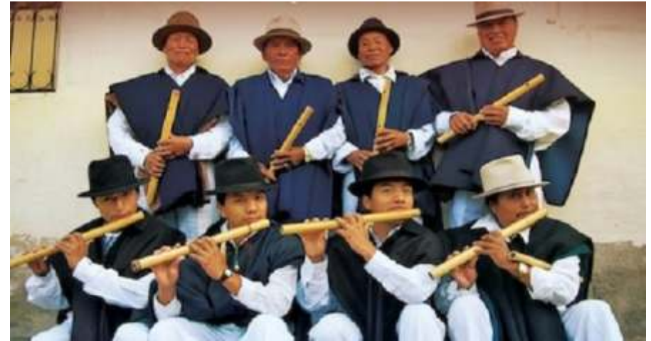
Imagen 12. Intérpretes de gaitas en Kotama.

Imagen 11 (pág. ant.). Intérpretes de gaitas en Otavalo.