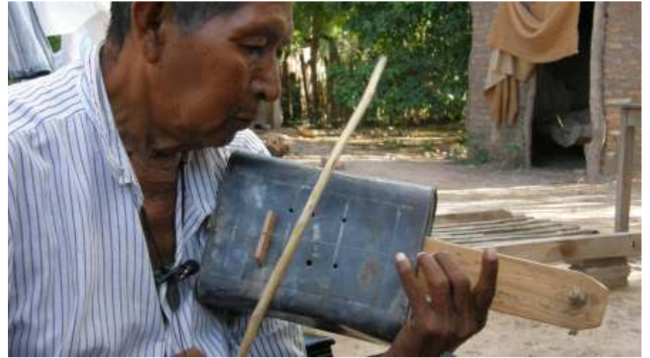
Imagen 21. Intérprete de nwiké ..