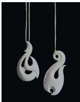
Arte maorí Máscara de madera y pendientes de hueso