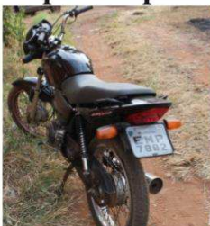
Motocicleta estava com chassis rasgado e placa feita artesanalmente, mas que a mesma estava sem chassis rasgado. Pelo tipo que apresentava esse chassis, a mo-

De acordo com o policial, não foi localizada nenhuma testemunha do abandono desta motocicleta e a polícia constata-