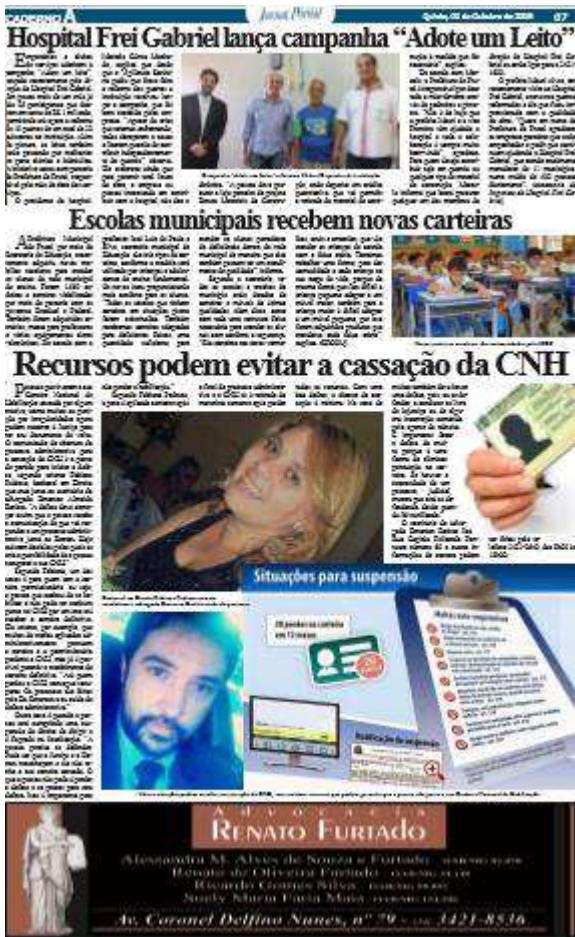
Figura 2 – 7ª página (Caderno A) do Jornal Pontal de 1º de outubro de 2015