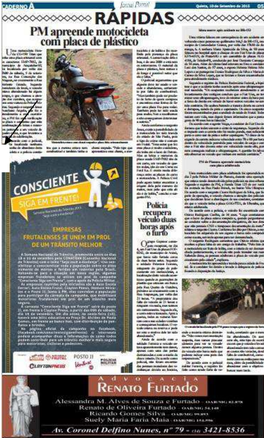
Figura 5 – Página 5 do Caderno A do Jornal Pontal de 10 de setembro de 2015

A seguir, a ocorrência de mais um caso que evidencia a preferência pelo noticiário local.