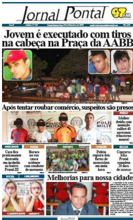
Figura 1 – Primeira página do Jornal Pontal de 24 de setembro 2015

Na maioria das amostras (nove de dez), 6 (seis) páginas eram coloridas e 8 (oito) eram em preto e branco.