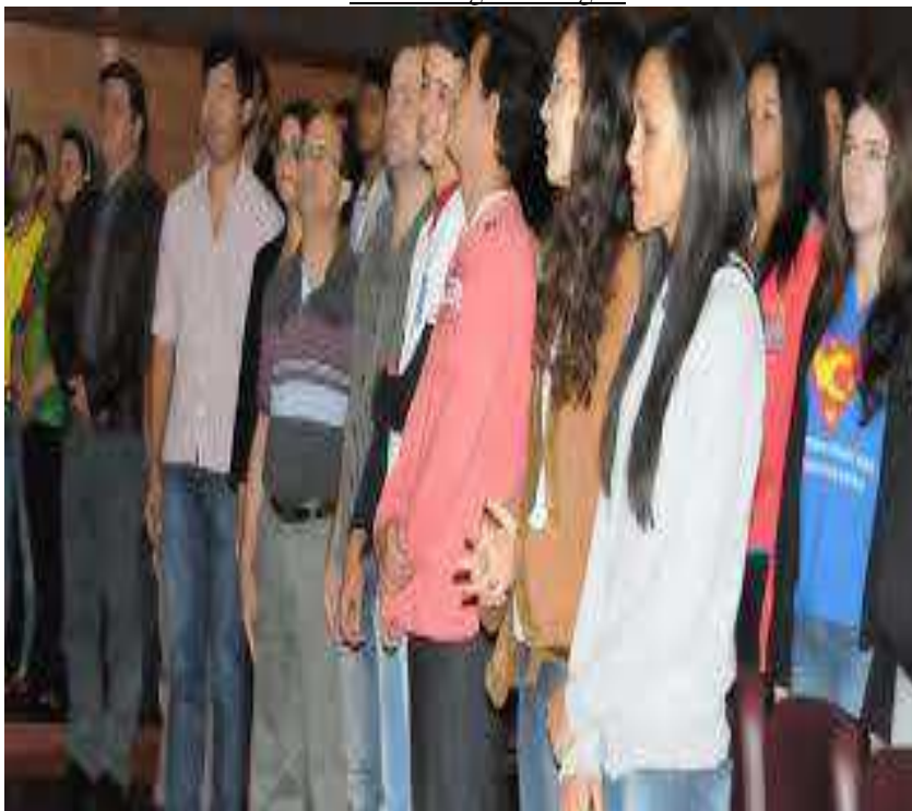
Figura 2: “Alunos da Escola Estadual Vicente Macedo na Feira de Profissões”.