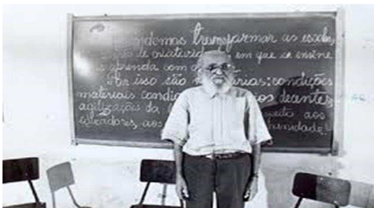
Figura 3: “Paulo Freire”.