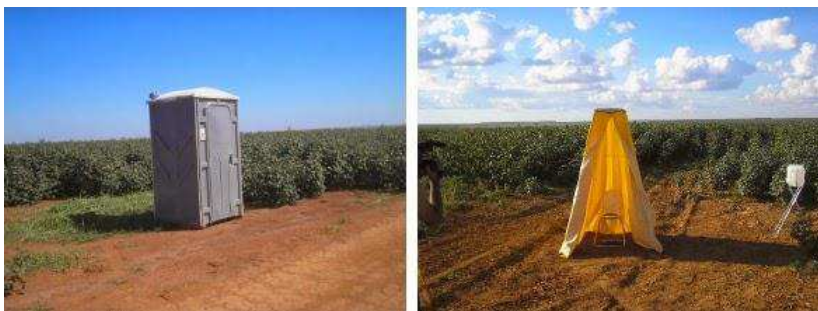
IMAGEM 1 e 2

As aludidas imagens demonstram áreas precárias nas áreas de trabalho no campo, sendo