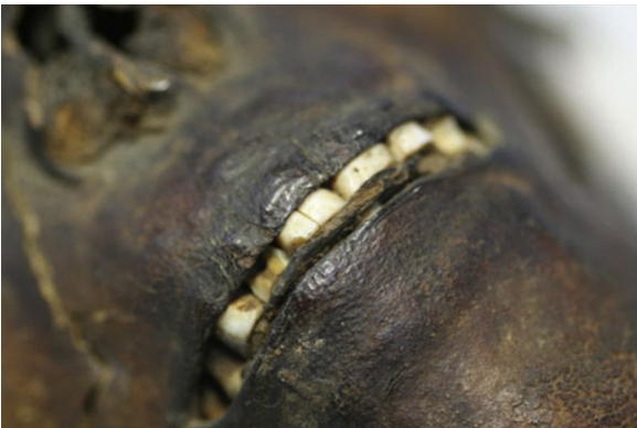
Figura 2 Cráneo momificado ME-006 del Museo de Antropología Forense de la UCM. Detalle.

Según al análisis antropométrico el cráneo corresponde a una mujer de unos 30-35 años de raza caucásica y variedad tipológica mediterránea (grácil) 7-11 .