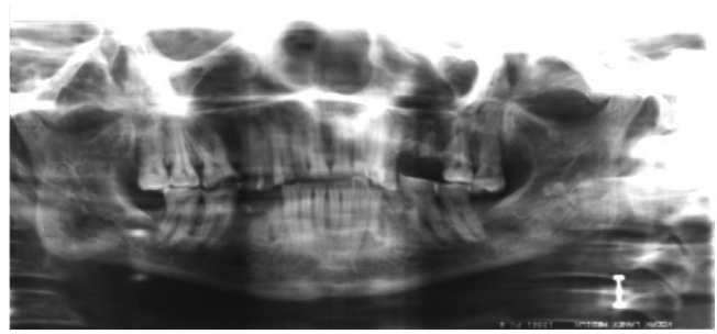
Figura 4 Cráneo momificado ME-006 del Museo de Antropología Forense de la UCM. Ortopantomografía.

potencial constante SHF de 50 Kw de SEDECAL y sistema de rayos X panorámico General Electric GE3000®.