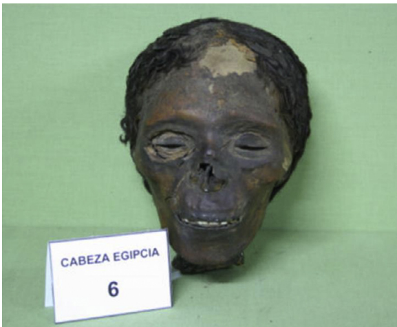
Figura 1 Cráneo momificado ME-006 del Museo de Antropología Forense de la UCM.