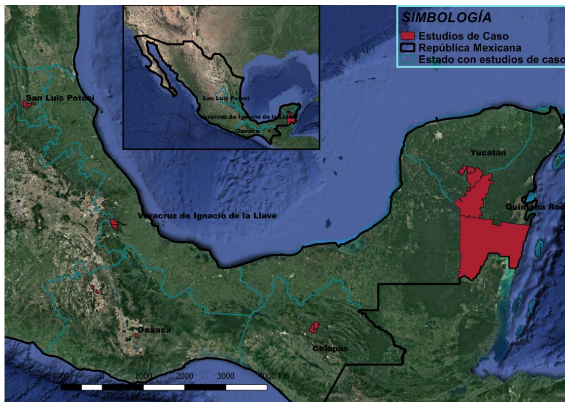
Imagen 1: Mapa de localización