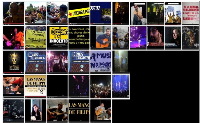
Gráfico de elaboración propia

Asimismo, observamos una fuerte impronta de la música. Dentro de esta categoría encontramos imágenes que hacen alusión al rock como así también a otros géneros musicales como el reggae. Las denominamos “ imágenes de la memoria ” Del mismo modo, hay una gran influencia del diseño y de la cultura del tattoo. Dentro de lo que clasificamos como rock y dentro de la dimensión música, aparecen 50 avatares que hacen referencia a Callejeros , ya sea en una bandera como la imagen del cantante de la banda. En otra clasificación observamos imágenes que aluden explícitamente a la tragedia de Cromañón, y su relación con Callejeros .