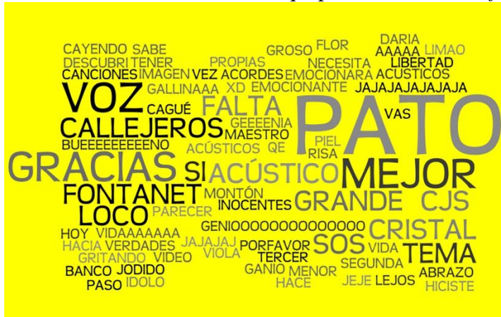
Gráfico de elaboración propia

Por otro lado, las mismas continuaban apareciendo en la nube de palabras cuyo eje continuaban siendo la MÚSICA. Continuando nuestro proceso investigativo, realizamos la misma metodología con el video más comentado. Aquí perdió fuerza Callejeros y su valor se trasladó a la palabra Pato .