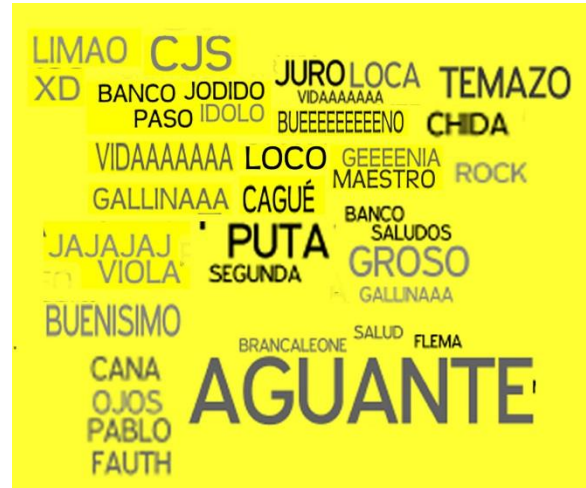
Gráfico de elaboración propia

Existe también una fuerte aparición de palabras que referencian sensaciones, que nos devuelven los sentidos, una vuelta al cuerpo: emociona, piel, ojos, gente, ahogo, quema, sos, suspiros, gritando, cayendo, toca, pena, lágrimas, abrazo, entre otras. El discurso que se le asigna a Cromañón dentro de la plataforma es sentido a través del cuerpo y sus sensaciones , lo que posee un fuerte anclaje en relación a lo que fue realmente la Tragedia. La utilización de palabras que remiten al ahogo, a