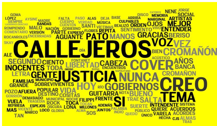
Gráfico de elaboración propia

En todo el proceso, observábamos desplazamientos: la mutación de la Tragedia de Cromañón se anclaba en dispositivo Callejeros .