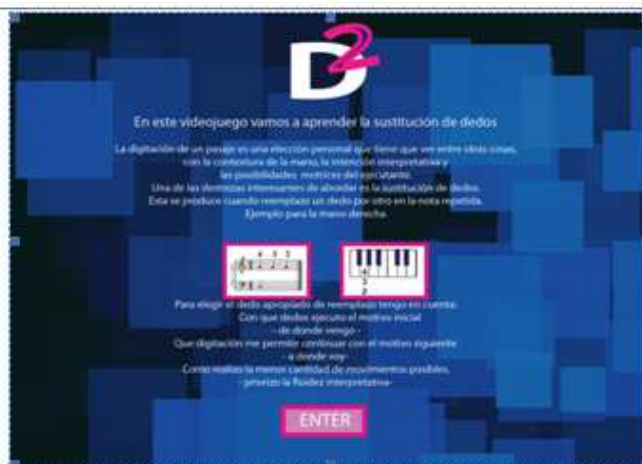
Figura 3 Introducción