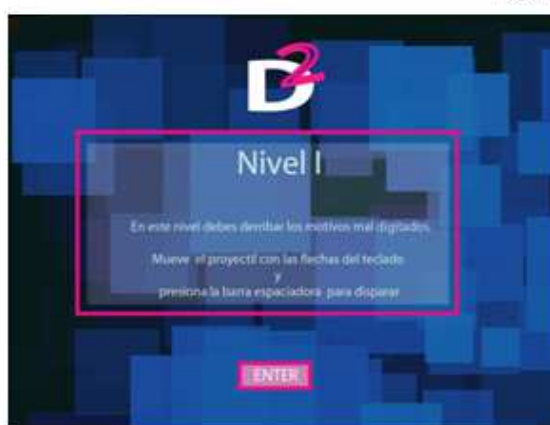
Figura 4 Instrucciones 1er nivel