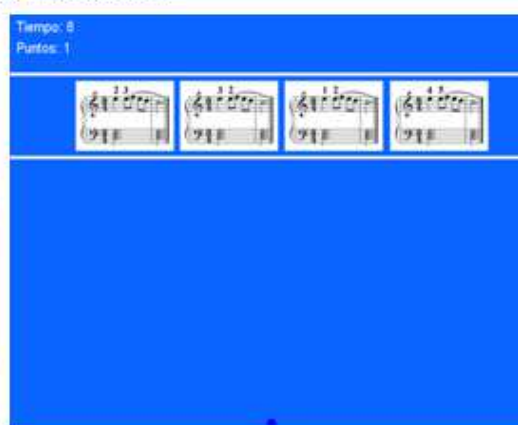
Figura 5 Juego propiamente dicho 1er nivel.

En el 1er nivel se muestran al jugador varios motivos que recorren la pantalla horizontalmente respetando el sentido de la lectura –izquierda/derecha-. Estos motivos tienen el mismo perfil rítmico/melódico pero están digitados de distinta manera. En estas digitaciones aparecen buenas y malas selecciones que el alumno deberá detectar para derribar las menos apropiadas. Si derriba un motivo bien digitado aparece una pantalla que le dice perdiste – figura 6- y le sugiere una pista –feedback- para reanudar el desafío y si derriba a los mal digitados aparece la pantalla que le dice ganaste –figura 7- y le muestra las mejores posibilidades de digitación de dichos motivos.