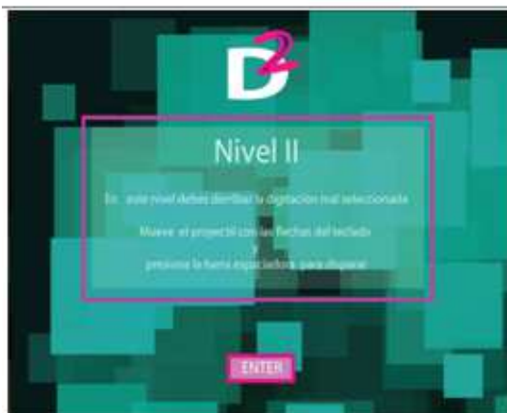
Figura 8 Instrucciones 2do

El 2do nivel se inicia con una pantalla – figura 8- donde constan los propósitos y las instrucciones de este nivel y luego aparece el juego propiamente dicho.