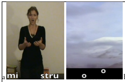
Figura 2. Señalización visual de los intervalos target en los estímulos audiovisuales.

Combinando imágenes y sonidos , se obtuvieron 4 videos para las diferentes condiciones del experimento: Video 1 : imagen a y sonido a; Video 2 : imagen b y sonido a; Video 3 : imagen b y sonido b; Video 4 : imagen b y sonido c. Para indicar a los oyentes el intervalo cuyo tamaño debían estimar (intervalo target), los videos 1 y 2 fueron señalizados visualmente con la aparición en tiempo real del texto que la cantante articulaba en los dos sonidos que conformaban cada intervalo seleccionado (Figura 2a). En los videos 3 y 4, debido a que la melodía era instrumental, sin texto, los intervalos seleccionados fueron señalizados con círculos que aparecían en el momento en que sonaba cada nota (Figura 2b).