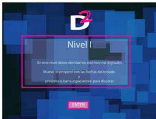
Figura 4 Instrucciones 1er nivel