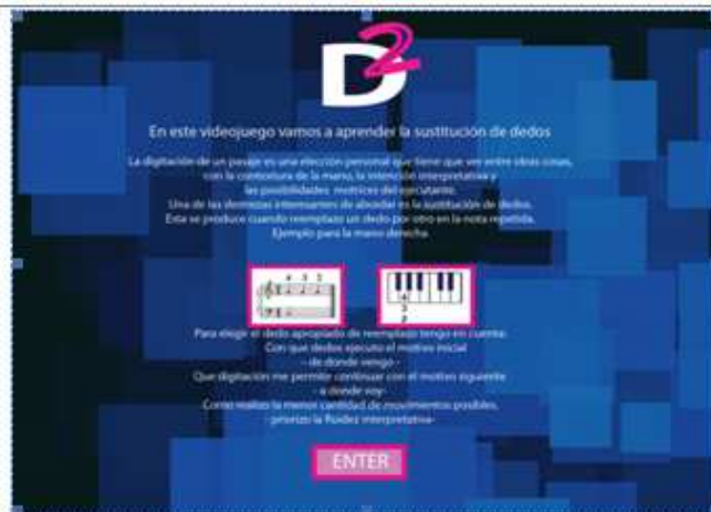
Figura 3 Introducción