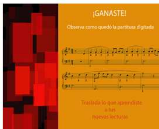
Figura 11 Ganaste