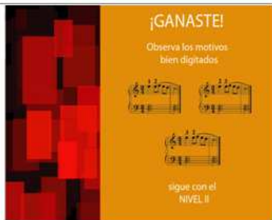
Figura 7 Ganaste

El 2do nivel se inicia con una pantalla – figura 8- donde constan los propósitos y las instrucciones de este nivel y luego aparece el juego propiamente dicho.