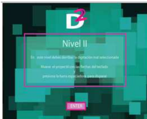
Figura 8 Instrucciones 2do

El 2do nivel se inicia con una pantalla – figura 8- donde constan los propósitos y las instrucciones de este nivel y luego aparece el juego propiamente dicho.