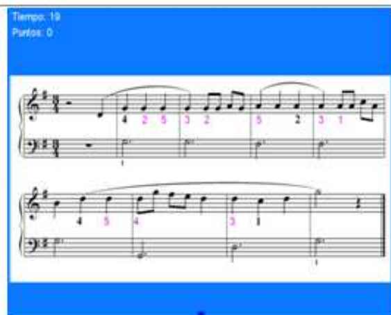
Figura 9 Juego propiamente dicho 2do nivel

En este 2do nivel -figura 9- se muestra al jugador una imagen con una frase completa de 8 compases cuyo perfil melódico está caracterizado por la reiteración de notas repetidas. Esta imagen estática presenta una serie de digitaciones en dos colores: las que están en color negro tienen el propósito de situar al jugador en un contexto digital y las que están en color rojo deben ser seleccionadas o derribadas según sus criterios. Estas digitaciones solo aparecen en las notas repetidas para que el jugador seleccione el dedo más apropiado puntualmente debiendo tener muy en cuenta el desenvolvimiento del discurso musical y aplique criterios que le impliquen pensar de donde viene, adonde va y como economiza movimiento .