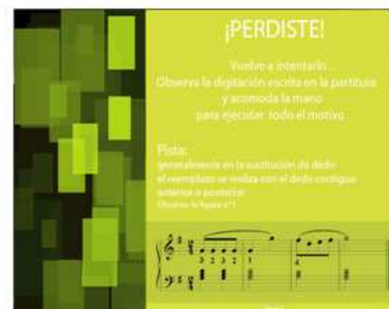
Figura 10 Perdiste

En estas figuras se muestra la secuencia de pantallas: