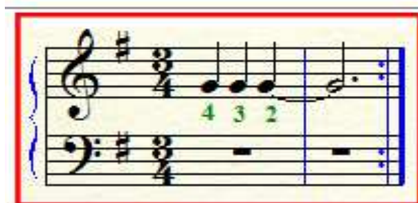
figura1 motivo con nota repetida

Para que la puesta en acto de la lectura -ejecución- se concrete es necesario comprometer la motricidad de ambas manos. Dicha motricidad se va a manifestar a través de diferentes movimientos, cuyo conjunto se conoce como técnica pianística. Aquí, en particular, interesan los movimientos implicados en la ubicación y el desplazamiento sobre el teclado, la pulsación de la tecla en el momento adecuado en cuanto a la sucesión y a la simultaneidad de los sonidos. De todos los patrones particulares de movimientos y sus combinatorias que pueden dar lugar en la tarea de lectura hemos tomado, a manera de ejemplo, un movimiento prototípico denominado sustitución de dedos. Este movimiento permite reemplazar un dedo por otro en la presión de una tecla en la ejecución de notas repetidas, debido a que la alternancia de dedos proporciona tanto una velocidad de ejecución mayor, como una articulación más legato (ya que permite que la tecla permanezca presionada más tiempo) que la utilización del mismo dedo. En la figura 1 se puede ver un motivo musical que requiere de la sustitución de dedo y en la figura 2 su realización en el teclado.