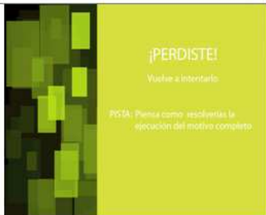
Figura 6 Perdiste