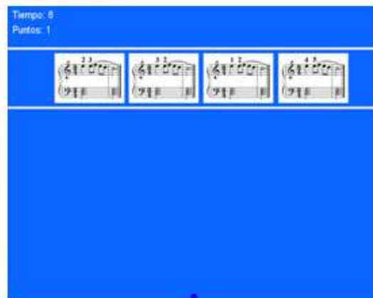
Figura 5 Juego propiamente dicho 1er nivel.

En el 1er nivel se muestran al jugador varios motivos que recorren la pantalla horizontalmente respetando el sentido de la lectura –izquierda/derecha-. Estos motivos tienen el mismo perfil rítmico/melódico pero están digitados de distinta manera. En estas digitaciones aparecen buenas y malas selecciones que el alumno deberá detectar para derribar las menos apropiadas. Si derriba un motivo bien digitado aparece una pantalla que le dice perdiste – figura 6- y le sugiere una pista –feedback- para reanudar el desafío y si derriba a los mal digitados aparece la pantalla que le dice ganaste –figura 7- y le muestra las mejores posibilidades de digitación de dichos motivos.