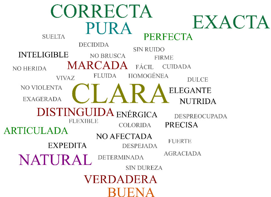
Figura 1. Palabras que hacen alusión a la pronunciación en el canto. Han sido representadas según su frecuencia de aparición mediante su color y tamaño.