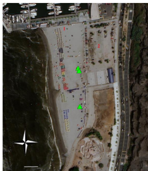
Figura 2. Playa Las Sombrillas. Δ: puntos de monitoreo, 1: zona de uso recreacional, 2: zonas de otro uso (estacionamiento y zonas no arenosas).

Estando la playa limpia, se procedió al conteo de la afluencia de bañistas con el fin de determinar la cantidad de residuos sólidos generados por personas durante el día, al igual que la composición de dichos residuos. El conteo se llevó cabo por medio de tres puntos de monitoreo (Figura 2).