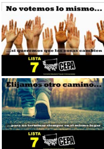
Página "La Cepa San Luis" 20/06/2016

El estilo beligerante esta vez aparecía en los carteles de la CEPA, de manera elíptica haciendo referencia a la permanencia de Franja Morada en la conducción del Centro de Estudiantes: