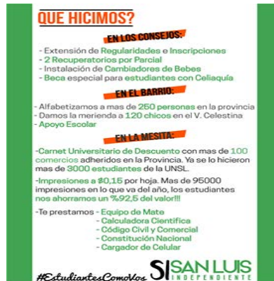
Página San Luis Independiente – FICA – FCEJS - 21 de junio 2016

¿Cómo es la interacción de cada agrupación con los estudiantes por medio de la red social Facebook? Nos propusimos observar el comportamiento de los jóvenes en las redes sociales a partir de una descripción cuanti y cualitativa.