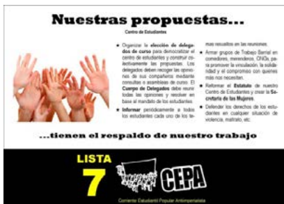
Página La Cepa San Luis 20 de junio 2016