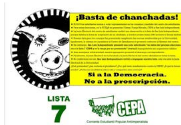
Página "La Cepa San Luis" 13/06/2016

Y con un mensaje claro de rechazo a la lista San Luis Independiente a raíz de una impugnación presentada por esta última agrupación: