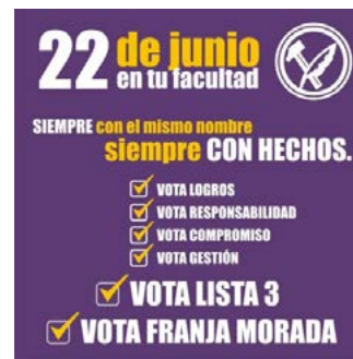
Página "Franja Morada Villa Mercedes" 02/06/2016

Este mismo estilo se puede observar en la página de Franja Morada, cuando remarca en uno de sus carteles "siempre con el mismo nombre", una alusión a la agrupación San Luis Independiente que en anteriores elecciones se presentó con el nombre "De frente independiente"