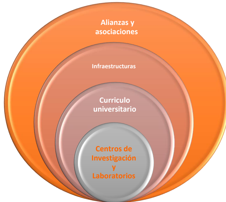
Imagen 1. Institucionalización de las Digital Humanities

La institucionalización del campo de las Digital Humanities incidió, como era de esperar, en nuevos modos en los que las universidades y las agencias evaluadoras reformularon el valor del trabajo de los investigadores y la calidad de los resultados de la actividad científica y docente. Un llamado de atención fue el del artículo publicado en Our Cultural Commonwealth de 2006 en el que la Commission on Cyberinfrastructure in the Humanities and Social Sciences explicaba que: