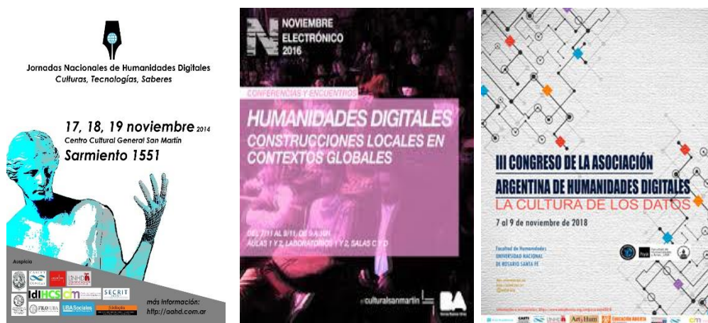
Pósters de los tres congresos de la Asociación Argentina de Humanidades Digitales (AAHD), 2014-2016-2018.

La cultura de los datos fue el eje que guió las presentaciones y debates del tercer congreso internacional de la Asociación Argentina de Humanidades Digitales (AAHD), que organizamos en la Universidad Nacional de Rosario en el año 2018 2 . El título tiene algo de orgánico y fue gestándose desde los plurales de las primeras jornadas del año 2014 -Tecnologías, Culturas, Saberes 3 - y desde las construcciones y contextos que cruzan lo local y lo global en nuestro campo, tema que nos convocó en 2018, apropiándonos de conversaciones de las Global Digital Humanities 4 .