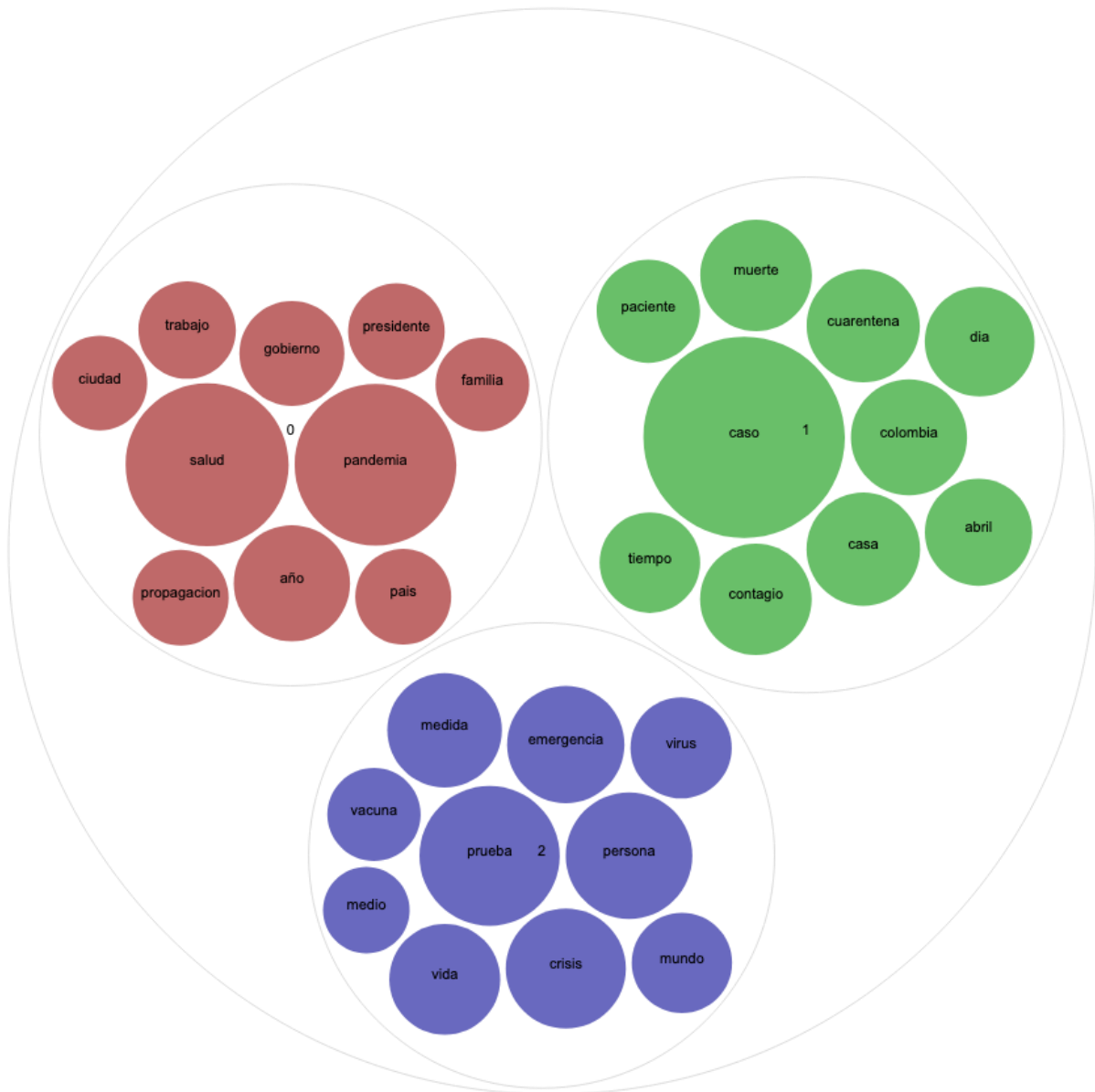
Figura 2. Tópicos de Colombia, 25 de abril de 2020. Elaboración propia.

debe destacar que en el corpus general la información sobre número de casos positivos, muertes, pacientes recuperados, hospitalizaciones, camas disponibles, etc., fue denominada Estadísticas , y se trató de un tópico consistente en todas las regiones y períodos, pues emergió con claridad en todas las experiencias realizadas; además se puede observar en el modelo una preponderancia en recuentos (número de casos, infectados, muertos), medidas sanitarias y cuestiones políticas (como medidas de prevención). De manera similar, se pudo estimar que los tweets de este tópico provenían normalmente de cuentas institucionales o de medios de comunicación y se focalizaron en diferentes escalas (global, nacional, local, institucional, etc.) a lo largo de la pandemia.