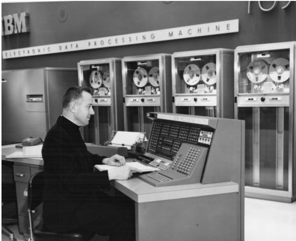
Roberto Busa, SJ, and the emergence of Humanities Computing, http://priestandpunchedcards.tumblr.com/

El trabajo netamente positivista de Busa y Ellison sería el puntapié inicial para una etapa ininterrumpida a lo largo de casi cincuenta años, dominada principalmente por los intereses de la lingüística computacional y la edición de textos literarios en Europa y Norteamérica. La conformación de centros de investigación como el Literary and Linguistic Computing Centre (LLCC) de la Universidad of Cambridge (1964), la celebración del Congreso Computers for the Humanities? en la Universidad de Yale en el año 1965, cuna de la revista científica nacida un año más tarde, Computers and the Humanities , el surgimiento de la Association for Literary and Linguistic Computing (ALLC) en 1973, y la aparición de publicaciones tan relevantes como Linguistica matematica e calcolatori de A. Zampolli en ese mismo año, y otras muchas entre las que apenas señalo A Guide to Computer Applications in the Humanities de Susan Hockey en 1980, se verían coronados por dos hechos que desembocarían en su esperada institucionalización: la constitución del consorcio de la Text Encoding Initiative en 1987, y la conformación del Master en HC en la Universidad de Virginia en el año 2001.