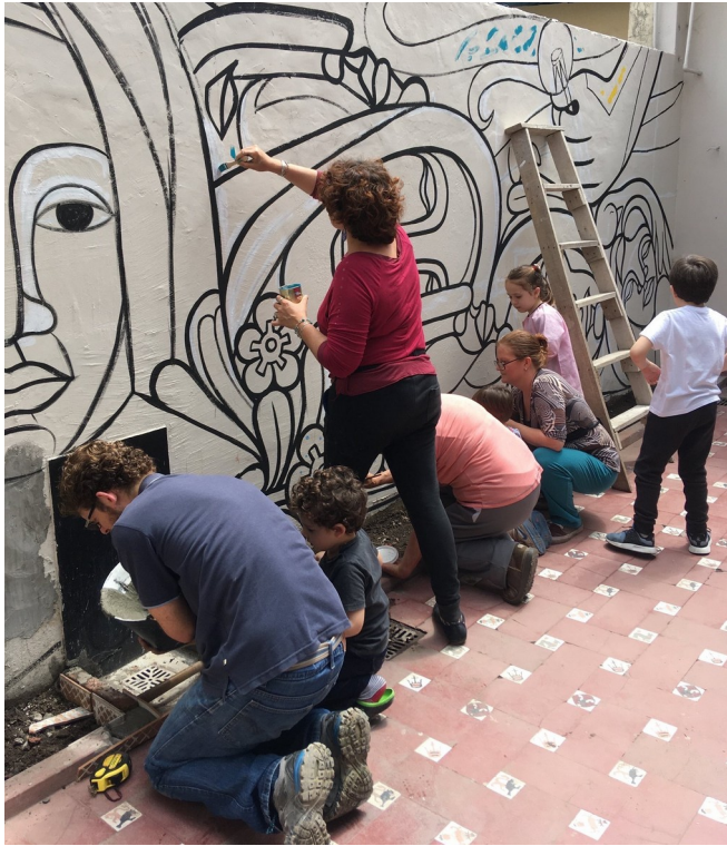
Parte del mural: