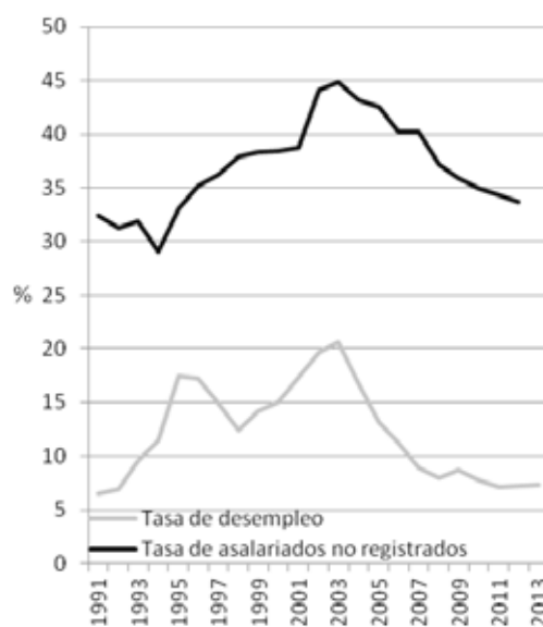
FIG. 1 INDICADORES DE EXCLUSIÓN SOCIAL EN EL MERCADO LABORAL ARGENTINO

La década de los 90 representa, en este sentido, un periodo de ruptura de los patrones socio-económicos del país, con profundos efectos sobre el funcionamiento de la seguridad social. En primer lugar, las medidas de política económica llevadas adelante bajo la presidencia de Carlos Menem (1989-1999) tuvieron un efecto negativo sobre el mercado laboral argentino 13 . En esos años, se observó la reducción del número de puestos de trabajo protegidos en el sector formal, y la paralela multiplicación del desempleo y la expansión de formas no reguladas de empleo para una parte muy significativa de la población activa (Figura 1). El incremento de los procesos de exclusión social en el mercado laboral, en particular de los trabajadores no registrados, es decir que no cotizan a la Seguridad Social, provocó un desfinanciamiento del sistema, ya que significó una caída considerable de los afiliados 14 .