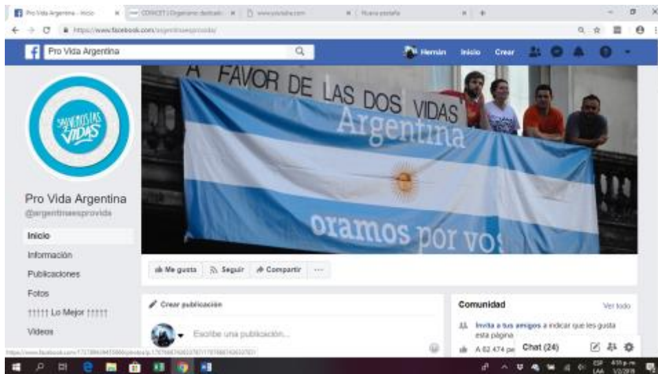
Figura: portada de la página Pro Vida Argentina. Consultado 1 de Febrero de 2019

El corpus de la investigación se desprende de un archivo (Arnoux, 2006), conformado por unas 40 publicaciones realizadas en la página de Facebook https://www.facebook.com/providaargentina/ y unas 30 publicaciones realizadas en la página de Facebook https://www.facebook.com/CampAbortoLegal/ durante el período 2014-2016. Asimismo, se relevaron un conjunto de materiales complementarios (textos escritos, documentos, boletines de noticias, etc.) en páginas web de ambas organizaciones.