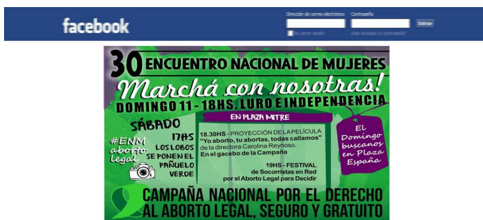
Documento 15. Publicado el 6/10/2015 en https://www.facebook.com/CampAbortoLegal/ . Consultado el 11/11/2016

La politización de la experiencia personal, o lo que es igual, el hacer público lo que corresponde al ámbito privado, se identifica como una de las estrategias retórico-argumentativas que el discurso de La Campaña desarrolla en este medio digital. Es por ello que en diversas publicaciones reconocemos la presencia de un “nosotras”, de tinte político, que puede ser definido en un doble sentido: “nosotras, las mujeres que militan en La Campaña ” y “nosotras, las mujeres que no militan en La Campaña ”. En ambos sentidos, la identificación del sujeto “mujeres” se plantea como un vínculo que unifica a las militantes con las no militantes, ya que en ambos casos se comparten experiencias referidas a las desigualdades de género ( gender ) así como a la interrupción del embarazo. El siguiente ejemplo ilustra la construcción de este sujeto colectivo: