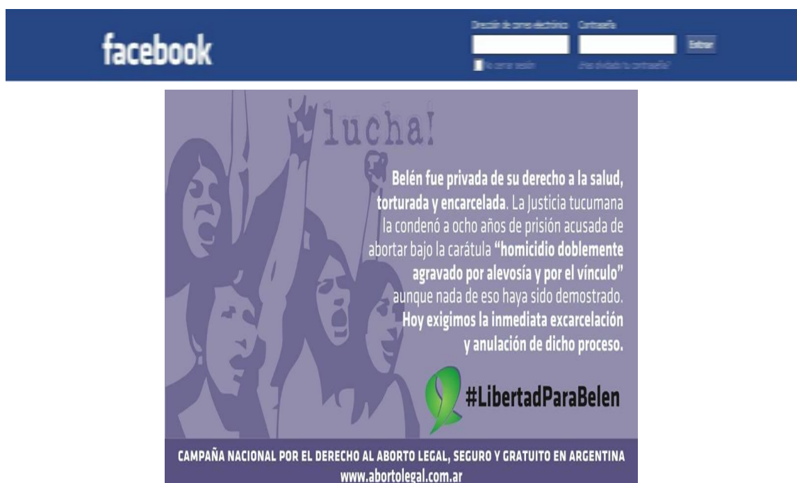
Documento 14. Publicado el 24/04/2016 en https://www.facebook.com/CampAbortoLegal/ . Consultado el 11/11/2016

Así lo demuestran los siguientes ejemplos: