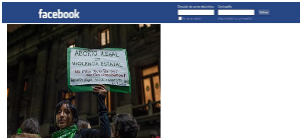
Documento 3. Publicado el 1/07/2016 en https://www.facebook.com/CampAbortoLegal/ . Consultado el 11/11/2016

La siguiente publicación presenta características similares a la anterior, con la diferencia de que la mujer que aparece en la imagen no está ilustrada, sino que es una persona física: