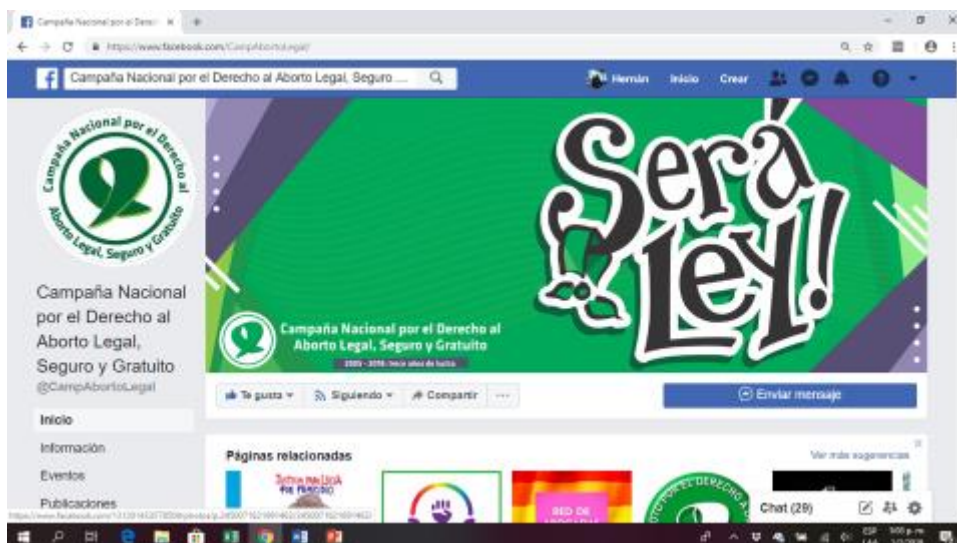
Figura: portada de la página Camp Aborto Legal. Consultado 1 de Febrero de 2019