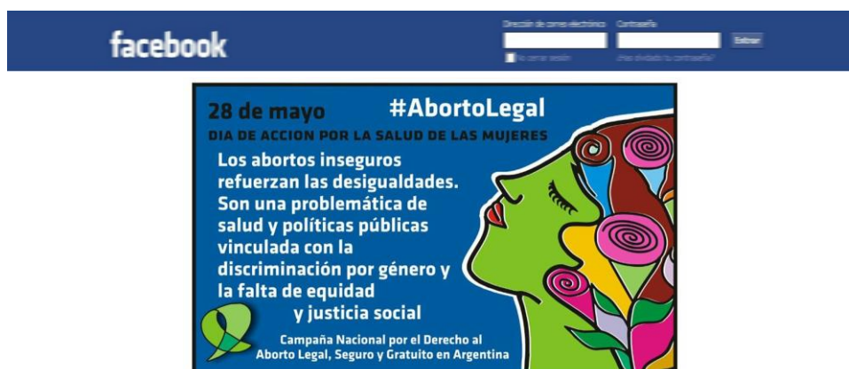
Documento 6. Publicado el 26/05/2016 en https://www.facebook.com/CampAbortoLegal/ . Consultado el 11/11/2016