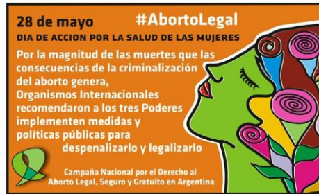
Documento 7. Publicado el 25/05/2016 en https://www.facebook.com/CampAbortoLegal/ . Consultado el 11/11/2016