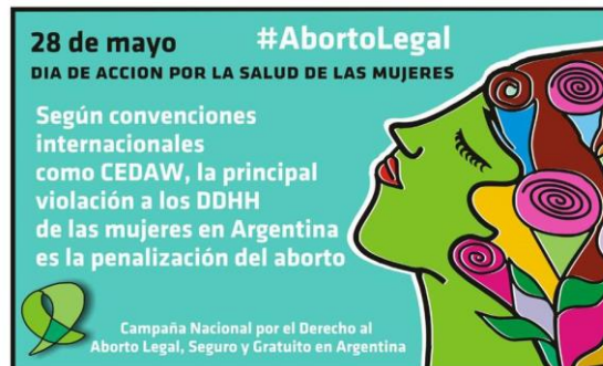
Documento 8. Publicado el 25/05/2016 en https://www.facebook.com/CampAbortoLegal/ . Consultado el 11/11/2016

El género ( gender ) se plantea como dimensión constitutiva de la explicación de la problemática de salud. En efecto, en el primer ejemplo se establece una vinculación entre el AV en tanto que problema de salud pública y la discriminación por género ( gender ).