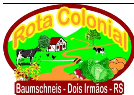
Figura 5 - Marca da Rota Colonial Baumschneis

Formatar um produto com essas características exige uma série de atividades preliminares para colocá-lo à disposição do público e foi isso que ocorreu nesse roteiro turístico. Verificou-se que, ao longo de um período de dois anos, antes da implantação oficial da Rota Colonial, nos anos de 1998 e 1999, foram realizados estudos de viabilidade, os locais foram preparados e os proprietários capacitados para receber os turistas e desenvolver o turismo em Dois Irmãos. Nesse mesmo período foi criada a marca da Rota, apresentada na Figura 5. A mesma faz menção à zona rural de Dois Irmãos, caracterizando os atrativos do roteiro, representada por um caminho que tem em seu trajeto uma casa na técnica de construção enxaimel, árvores, verduras, alguns animais como vacas e galinhas e os dois morros que dão nome ao município de Dois Irmãos.