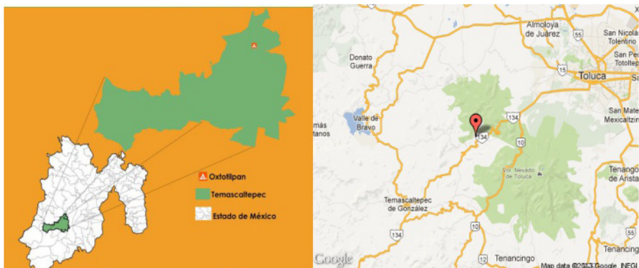
MAPA 1. Mapa localización San Francisco Oxtotilpan