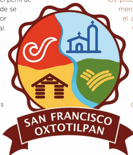
Figura 3. Propuesta final para la Marca Territorial de San Francisco Oxtotilpan, Estado de México.

Los resultados de esta investigación pueden ser de utilidad para los habitantes de la comunidad de San Fran-