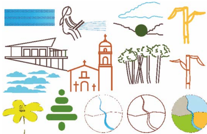
Figura 2. Imágenes representativas del territorio de San Francisco Oxtotilpan, Estado de México.

Crear una marca territorial requiere de un proceso colectivo de conformación de símbolos para la materialización de una identidad local que permita distinguir el ellos