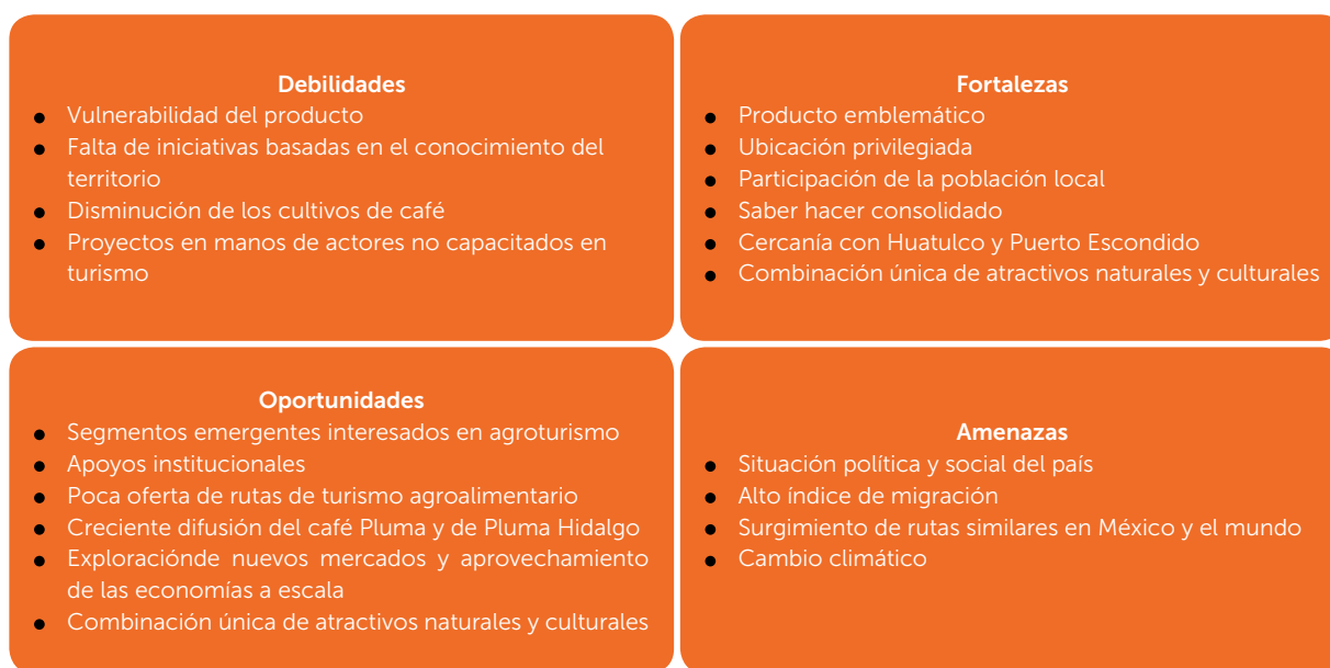
Figura 2. Análisis de Fortalezas, Oportunidades, Debilidades y Amenazas (FODA) como estrategia de diagnóstico con el objetivo de determinar los factores principales involucrados en la planeación del proyecto del circuito agroturístico del café Pluma como un negocio en el municipio de Pluma Hidalgo, Oaxaca, México.

Es necesaria la planeación estratégica en manos de personas capacitadas en proyectos similares, pues con