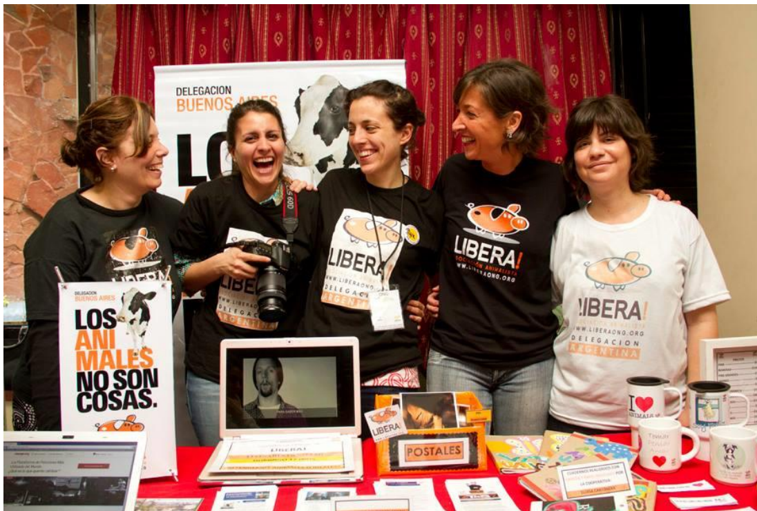
Recuperada de Facebook - Álbum Vegfest 7mo Congreso Vegetariano Latinoamericano 13-11-2013.