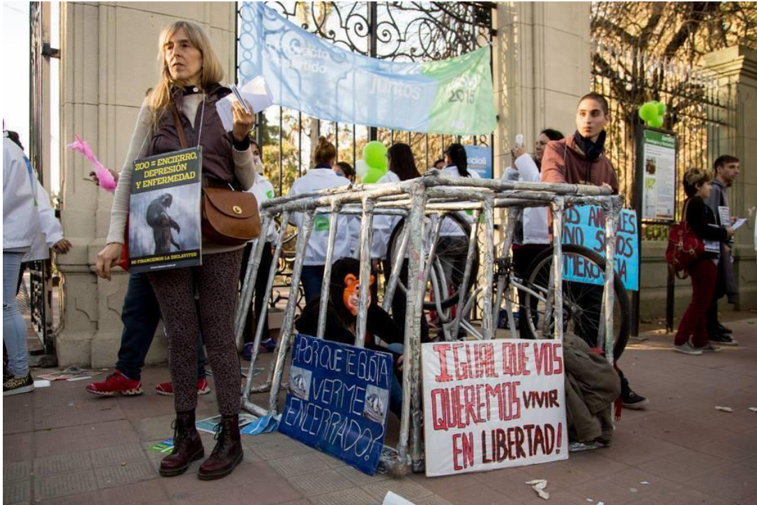
Recuperada de Facebook – Álbum Manifestación de Autoconvocados por el Cierre del Zoo. 29-07-2015.