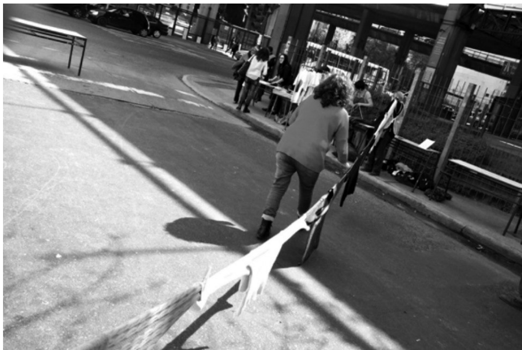
Imagen 4. Abrazo en la reinauguración del Centro Educativo Isauro Arancibia