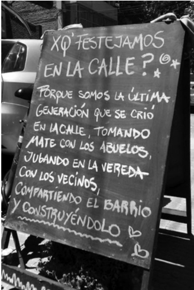
Imagen 3. Pizarrón del local In Lackech II