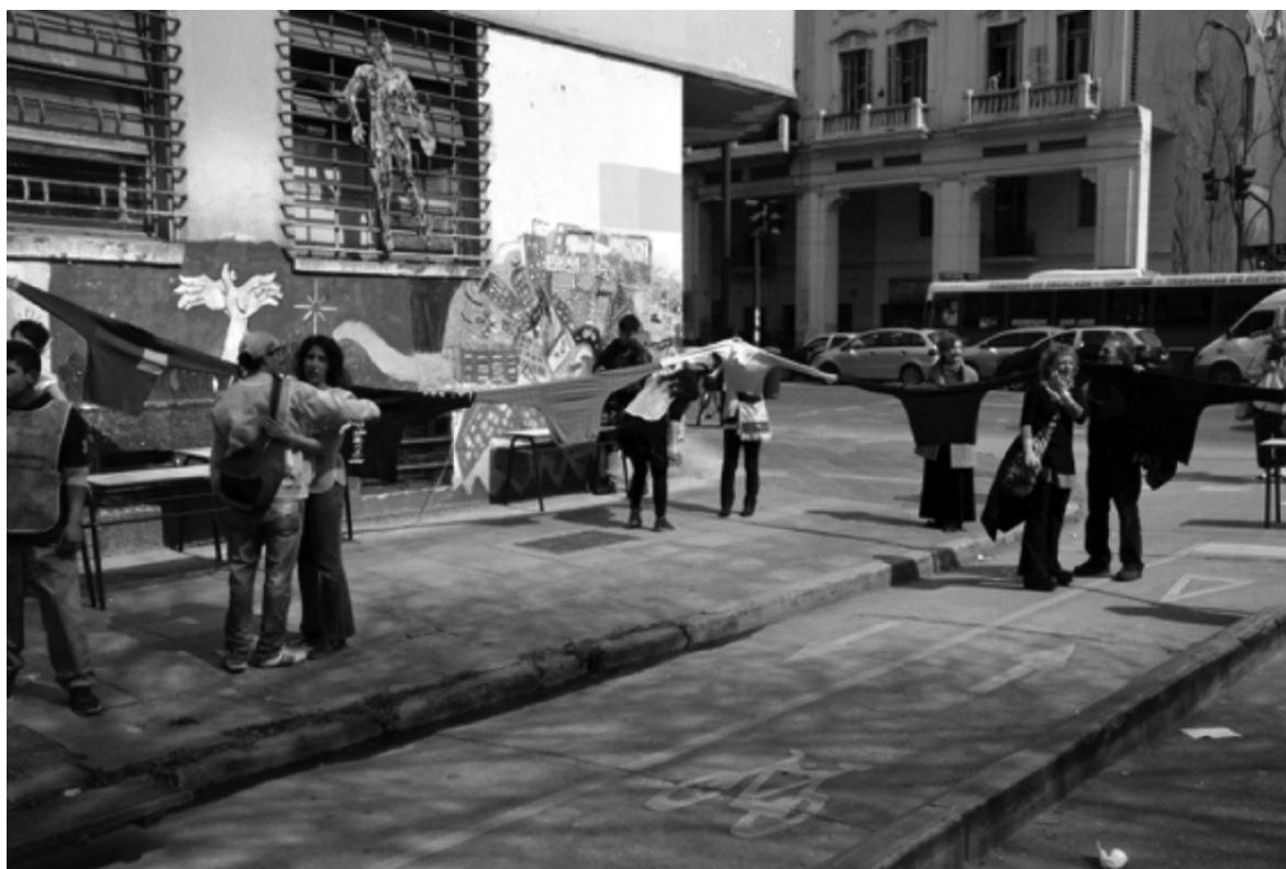
Imagen 5. Reinauguración Centro Educativo Isauro Arancibia