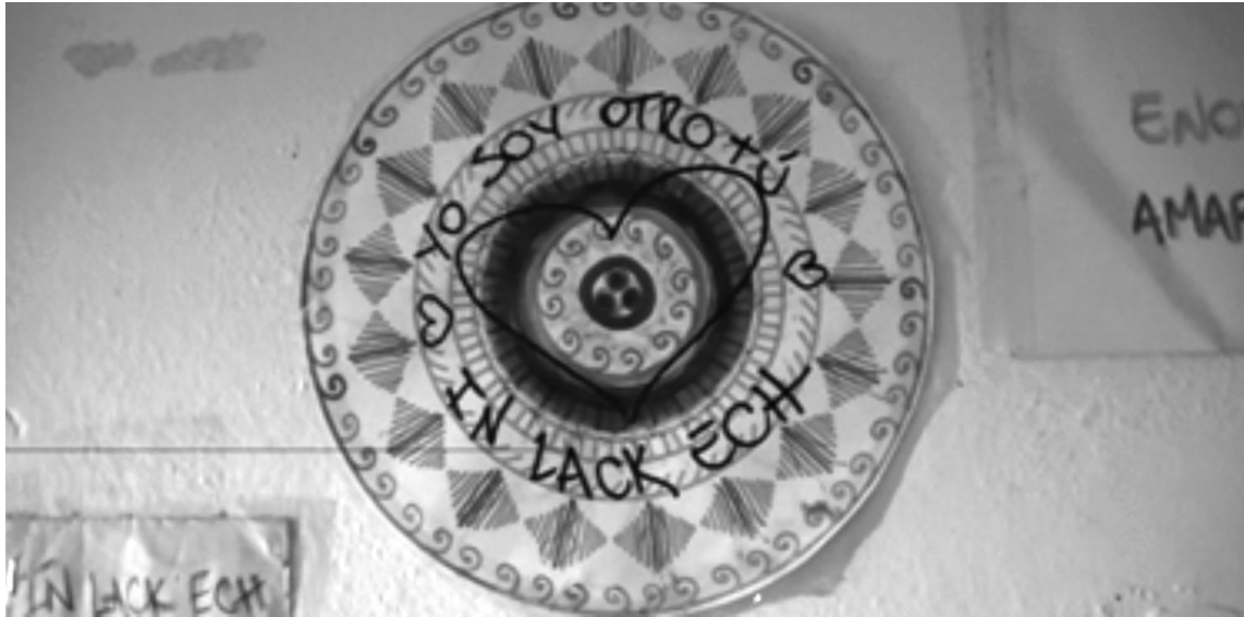
Imagen 1. Cartel del local In Lackech