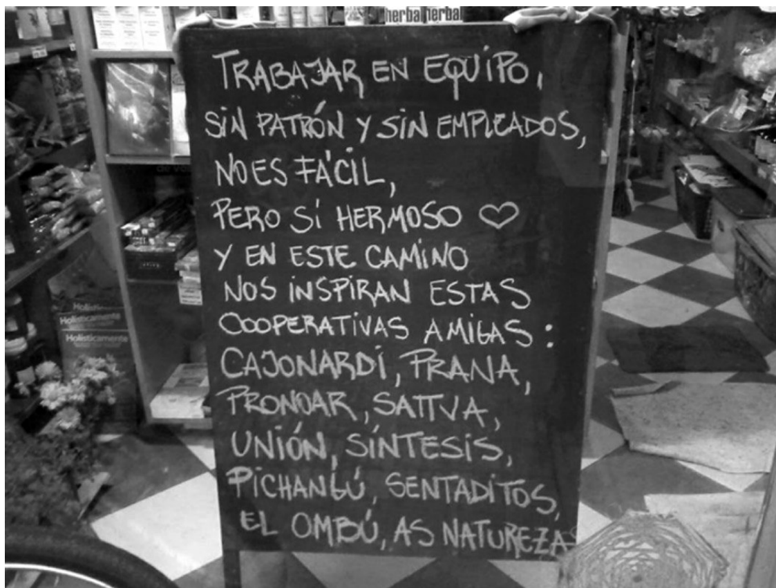
Imagen 2. Pizarrón del local In Lackech I