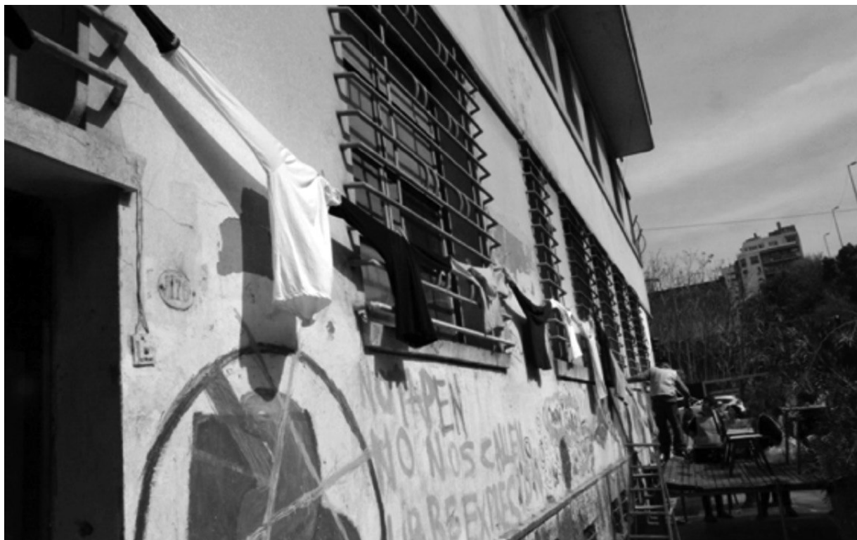
Imagen 6. Fachada del Centro Educativo Isauro Arancibia

El registro visual permite ver y oír la confluencia de dos aspectos de esta jornada: celebrar (la existencia del Centro, el edificio, la presencia de amigos y vecinos) y protestar (advertir acerca de la amenaza de derribar el edificio). Se ve una gran cantidad de estudiantes y docentes del CEIA con una pechera donde se lee “Isauro Arancibia, amor, tiza y libertad”. Estas palabras sintetizan tres funciones: contención y sostén emocional de los jóvenes (amor), enseñar y aprender (tiza) y finalmente educar para la libertad. El propósito final del Centro es que los estudiantes reflexionen y decidan sobre sus vidas. La acción político-cultural que analizamos pone el eje de la discusión en la necesidad de respeto por la dignidad de las vidas de los jóvenes, atravesados por la violencia social e institucional. Frente a la amenaza de demolición, la comunidad del Centro, los amigos y vecinos confrontan con una pasión alegre: celebran la remodelación de su edificio, de su lugar. Para concluir, presentamos las palabras que leyó una joven a través de la siguiente fotografía (imagen 7):