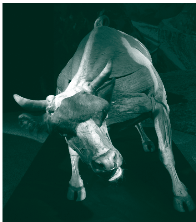
■ Bull - Taureau | © Gunther von Hagens' BODY WORLDS, Institute for Plastination, Heidelberg, Germany, www.bodyworlds.com

A su vez, nuestro modo de proceder en equipo, realizando análisis por separado y luego en forma conjunta, y procediendo a escribir entre las tres autoras, nos ha permitido sostener una triangulación permanente de las interpretaciones. En tanto cada una de nosotras tenemos formaciones diferentes, ponemos a circular conocimientos y análisis complementarios y distintos. Asimismo, en el desarrollo de esta escritura, hemos ido consultando e intercambiando resultados parciales junto a algunos de los participantes de las experiencias para realizar también una triangulación y una reescritura con ellos. Estamos en condiciones de afirmar que es esta posibilidad de trabajar junto a los colectivos lo que nos permite contactar con su vida cotidiana, situación que creemos no sería posible a no ser que planteemos, como hacemos, la generación de conocimiento colectivo en forma colaborativa.