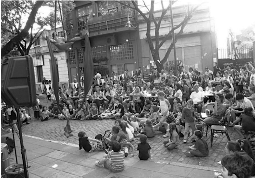
Imagen 9. Las mil mesitas. Circuito Cultural Marcos, año 2015