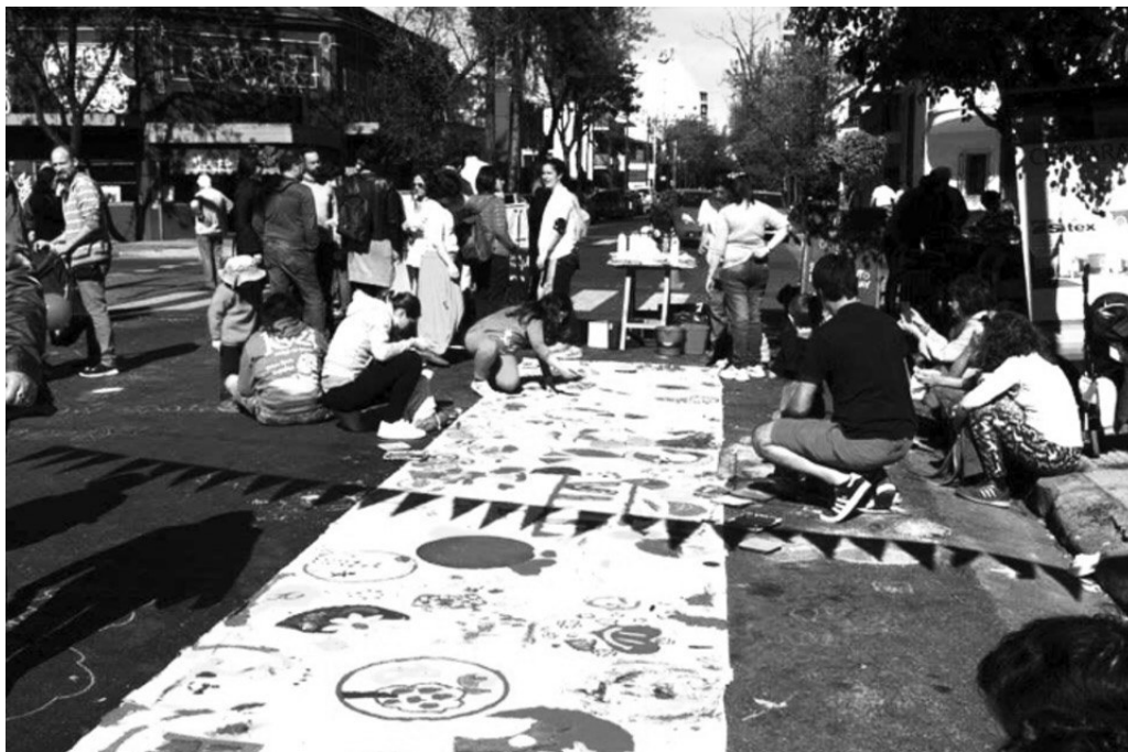
Imagen 10. Viví Colegiales. Circuito cultural Marcos, año 2016