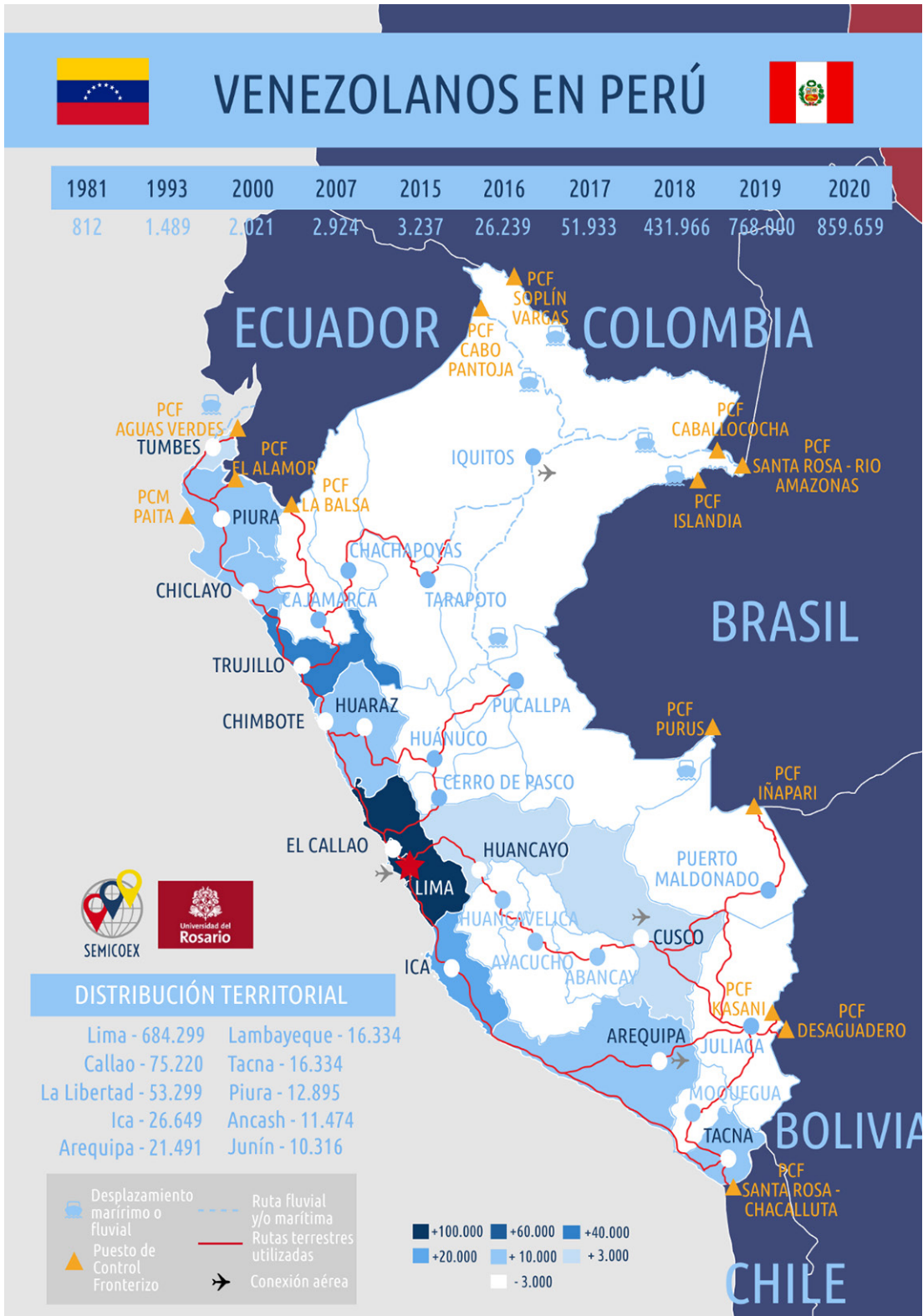
Mapa 3. Evolución, dispersión territorial y rutas de la migración venezolana en Perú.