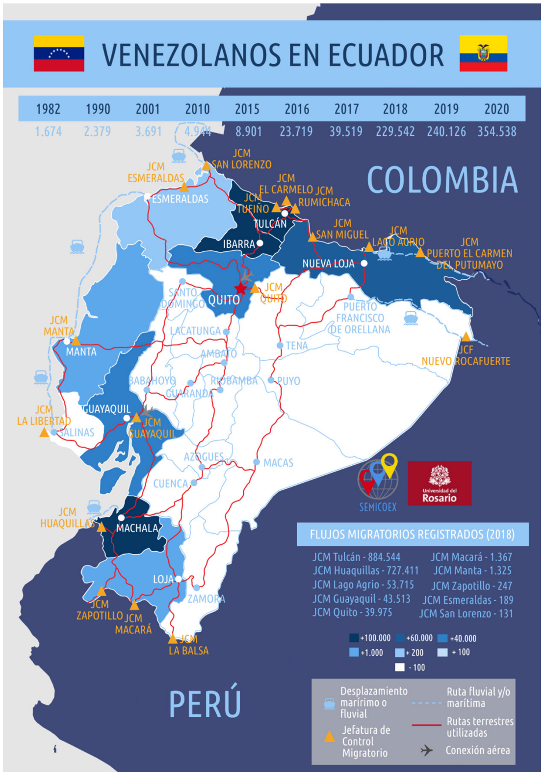
Mapa 2. Evolución, dispersión territorial y rutas de la migración venezolana en Ecuador.