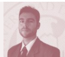
Por Justo M. Erede Master en Economía, UCEMA.

Cuando nos referimos al sistema legal hablamos del “mecanismo por el cual se formulan las normas o leyes” 1 , es decir, si la formación de las leyes está a cargo de un congreso o de un parlamento como son los casos de los sistemas jurídicos de derecho civil (donde se encuentran aquellos países que han sido principalmente influenciados por la tradición jurídica romana y que han adoptado una codificación sistemática de su derecho común) o del common law (podemos agrupar dentro de esta categoría a aquellas naciones en las cuales el derecho reposa sobre los conceptos y los modos de organización del derecho británico, que concede un lugar primordial a la jurisprudencia) que son los sistemas más difundidos en la actualidad.