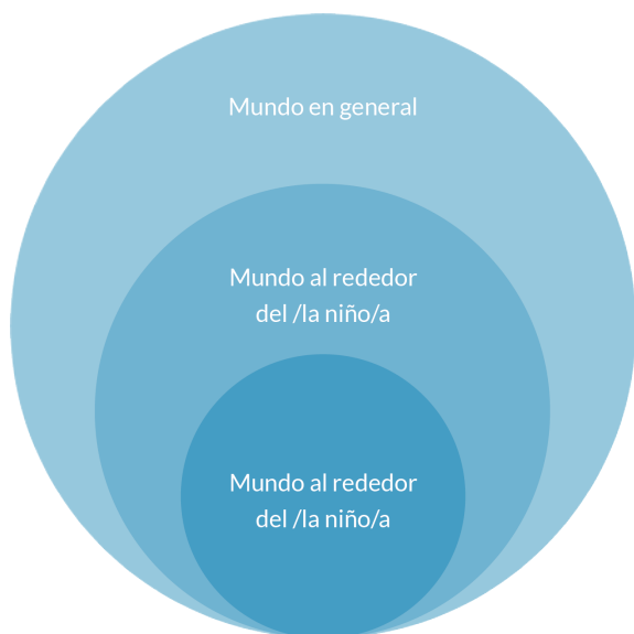
Figura 1. Esferas de influencia.