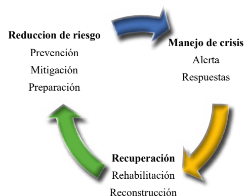
Gráfico N° 1: Circuito de reducción de riesgo