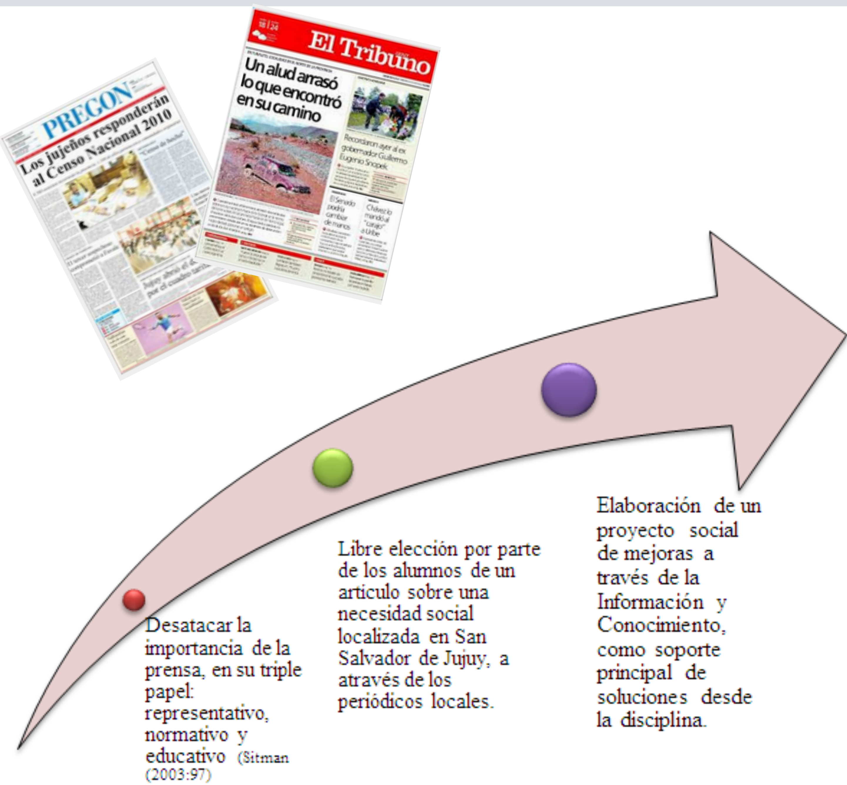
Principales diarios utilizados (impresos y en línea)